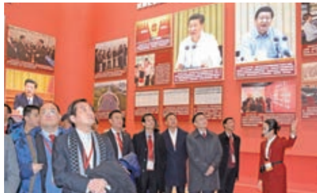
■訪問團一行參觀慶祝改革開放40周年展