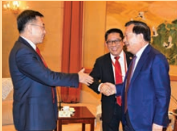
■全國政協副主席夏寶龍(左)、中聯辦副主任何靖(右)、理事長蘇長榮親切交談。

3日下午，國家發改委黃微波等相關領導接見了訪問團一行並展開了座談，介紹了大灣區建設的進展情況、對大灣區建設的思考以及未來的工作安排，並希望大家積極建言獻策。