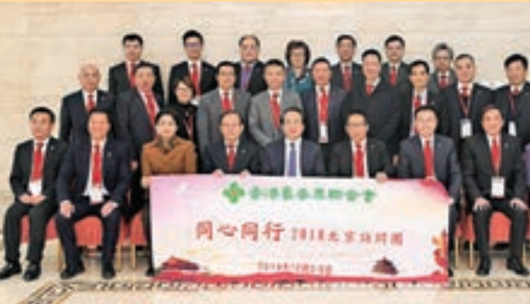
■中央統戰部副部長譚天星會見訪問團一行並合照