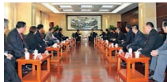
■國務院港澳辦主任張曉明與訪問團一行座談