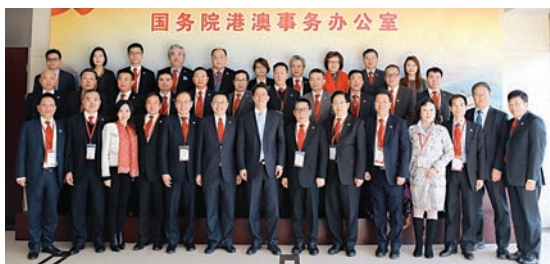
■國務院港澳辦主任張曉明會見訪問團一行並合照