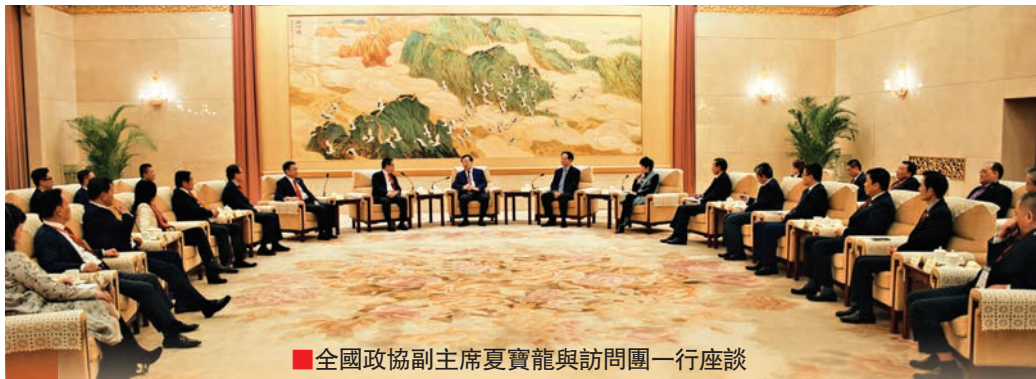
■全國政協副主席夏寶龍與訪問團一行座談