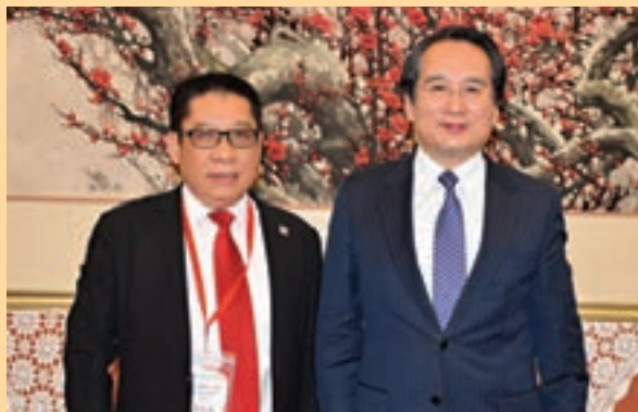
■中央統戰部副部長譚天星(右)與理事長蘇長榮合照。