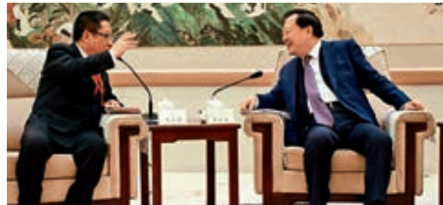
■全國政協副主席夏寶龍(右)與理事長蘇長榮親切交談