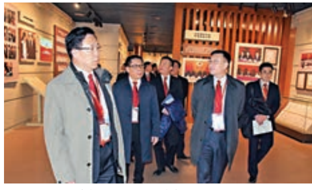
■訪問團一行參觀中國政協文史館