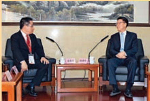
■國務院港澳辦主任張曉明(右)與理事長蘇長榮親切交談。