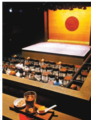
■「茶館劇場」內設約200個座位，對象為對戲曲認識不深的人士。

西九文化區管理局指，「茶館劇場」的對象為對戲曲認識不深的人士，每場演出長約90分鐘，當中除了有表演外，亦會安排司儀作出講解，而劇場除了設有一般公眾及學生場次外，亦會設有旅客場次，向不同群組宣揚戲曲文化。