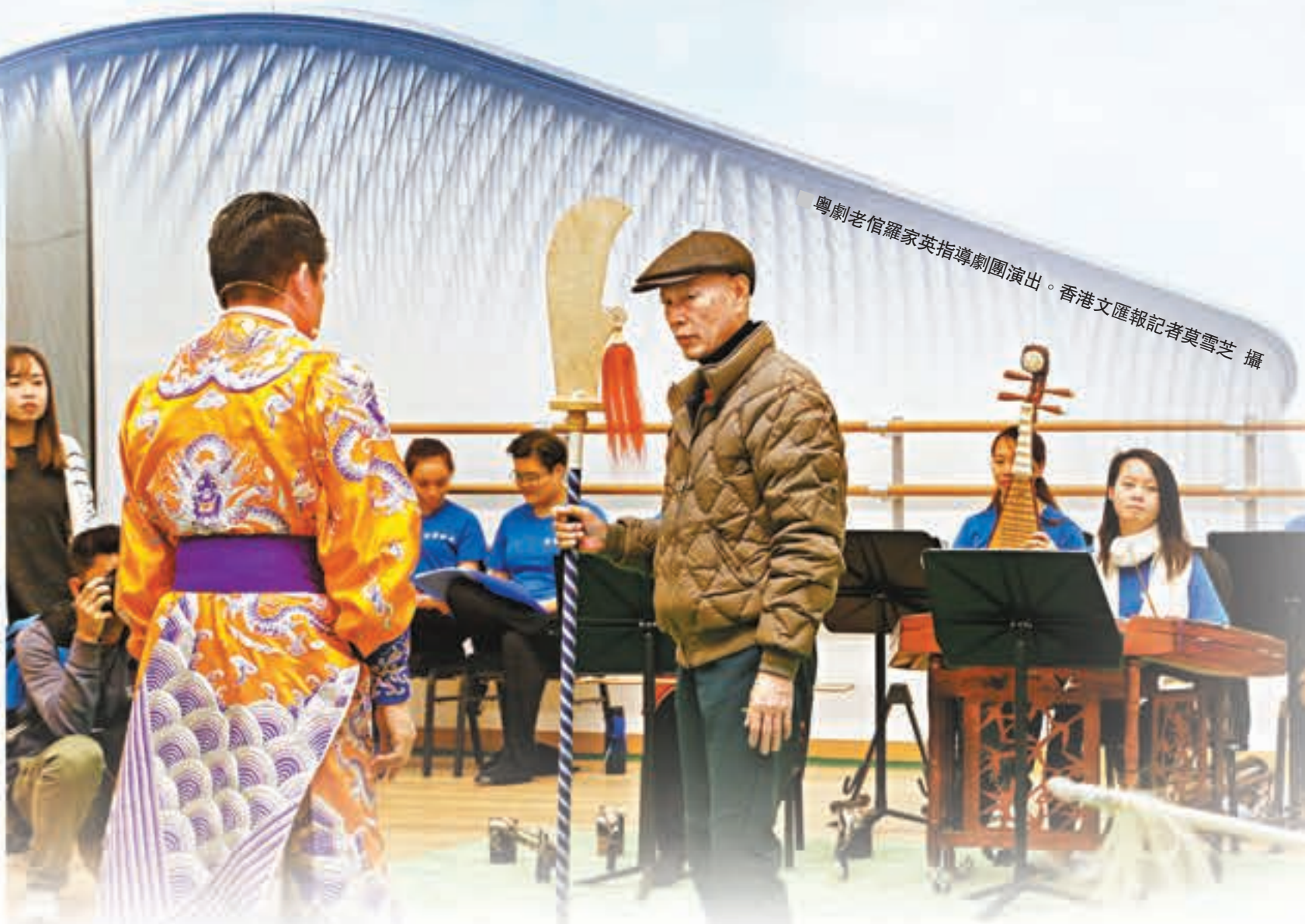
粵劇老倌羅家英指導劇團演出。

茹國烈強調，西九文化區管理局對「大劇院」現時的租用情況感到滿意，同時表示會密切留意租用情況，在適當時候作出檢討。