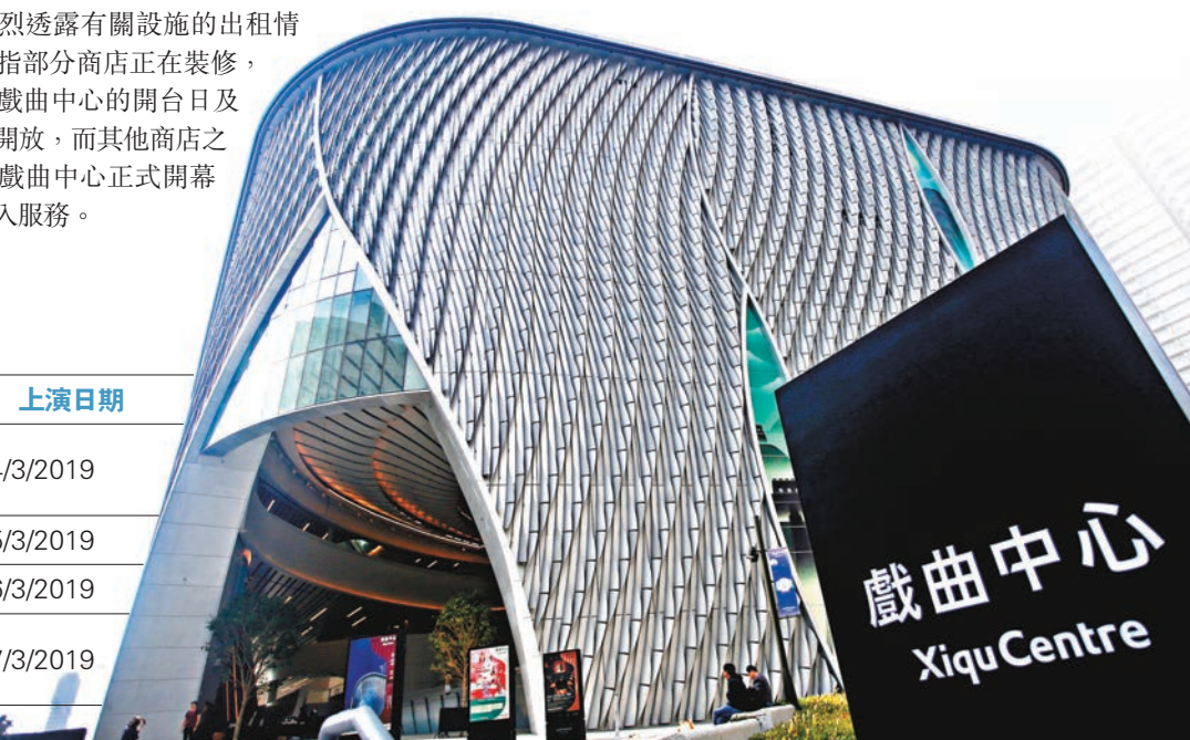
戲曲中心 Xiqu Centre