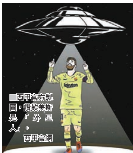
西甲官方製圖，讚歎美斯是「外星人」。