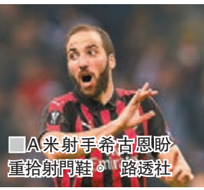
A米射手希古恩盼重拾射門鞋。

艾阿恩，將迎來剛捧南美自由盃的阿根廷老牌勁旅河床的挑戰。河床中場祖安昆特路與干沙路馬天尼斯狀態俱佳，爭勝添本錢。(本港時間周三0：30a.m.開賽)