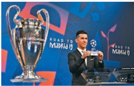
前利物浦名將路爾斯加西亞當今次歐聯抽籤嘉賓。

歐洲足協昨晚完成歐洲聯賽冠軍盃16強及歐霸盃32強的淘汰賽抽籤，歐聯矚目戲碼有曼聯對巴黎聖日耳門(PSG)、利物浦對拜仁慕尼黑及熱刺對多蒙特。