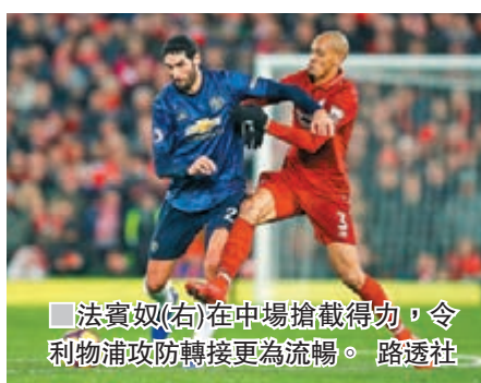
法賓奴(右)在中場搶截得力，令利物浦攻勢轉接更為流暢。