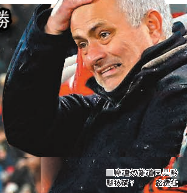
摩連奴難道已是黔驢技窮？