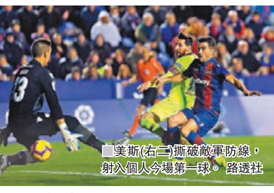
美斯(右三)撕破敵軍防線，射入個人今場第一球。

美斯是2018年第一個突破半百「土哥」的球星，3球2攻亦是其球員生涯第3次、近7年第1次能夠單場獨造5球。第43分鐘，他中圈加速從兩名守衛間穿過，奔襲半場殺入禁區再以右腳射入其本屆西甲第12球，助巴塞領先2：0，衝刺時速更高達32公里。西甲賽會賽後發佈了美斯在飛