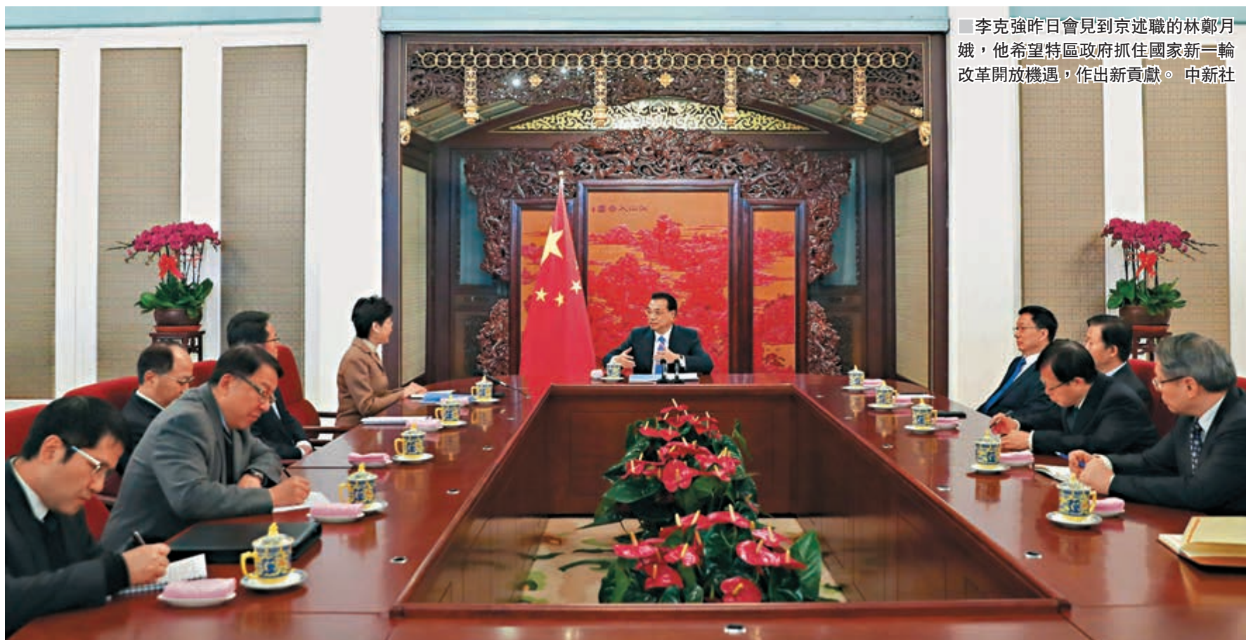
李克強昨日會見到京述職的林鄭月娥，他希望特區政府抓住國家新一輪改革開放機遇，作出新貢獻。

香港文匯報訊(記者 馬靜 北京報道)國務院總理李克強昨日會見到北京述職的香港特區行政長官林鄭月娥。他充分肯定特區政府過去一年工作，包括大力推進創科發展、想方設法解決民生問題、積極參與粵港澳大灣區建設，並特別提到香港作為自由港及單獨關稅區，在複雜國際形勢下保持了平穩經濟增長，來之不易。他希望特區政府抓住國家新一輪改革開放機遇，認為這有利於香港自身發展和需要，又能夠為國家繼續發揮獨特作用，作出新貢獻。