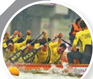
中華龍舟大賽總決賽現場。