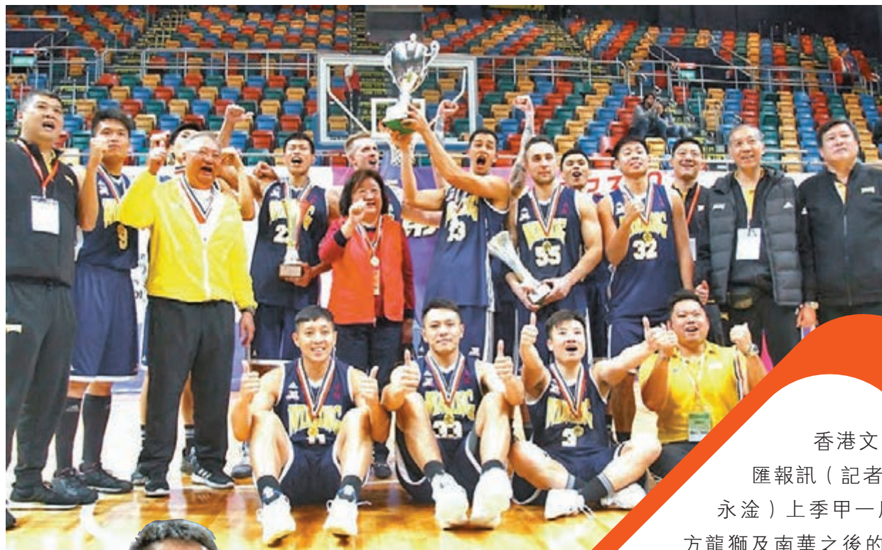
永倫賽後大合照。