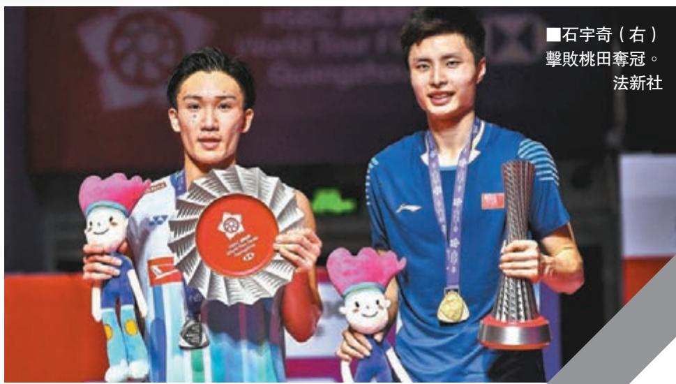
石宇奇(右)擊敗桃田奪冠。

比賽開始後,石宇奇展現出驚人的進攻火力,從始至終壓制對手。首局比賽,石宇奇21:12輕鬆獲勝。第二局,石宇奇連得三分,贏得良好開局。桃田賢斗雖然頑強追分,但似乎並沒有找到應對的辦法。最終21:11,石宇奇再次以壓倒式優勢獲得勝利。賽後,石宇奇表示,獎盃拿到手上的感覺非常棒,甚至幾乎激動到落淚,因為賽前並沒有把握奪得最後的冠軍:「當時小組抽籤後,我所在的小組實力非常強,出線並不容易。」至於戰勝對手的秘笈,石宇奇表示,桃田賢斗作為羽壇金字塔尖的選手,會有很多選手研究他,自己也不例外。另外,自己戰術執行得非常堅決,充分利用了後場空間。本場比賽後,石宇奇也坦言自己今後心態會更好:「以前面對桃田賢斗,有壓力時出球會亂,遇到壓力會自亂陣腳,戰勝桃田後,相信今後這種情況會大為改觀。」