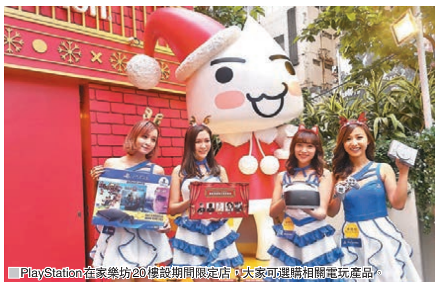
PlayStation在家樂坊20樓設期間限定店，大家可選購相關電玩產品。