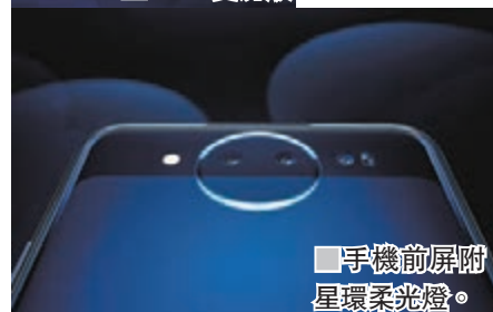
手機前屏附星環柔光燈