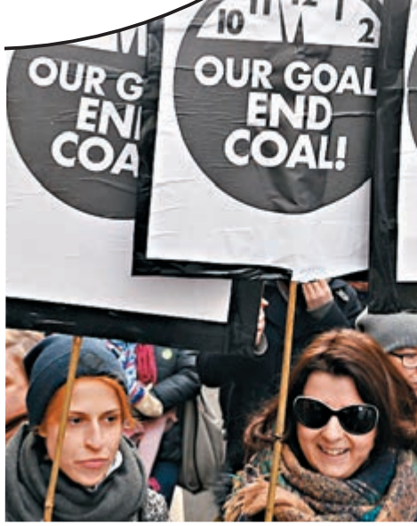
■ 關注氣候變化的示威者不滿各國減排步伐。