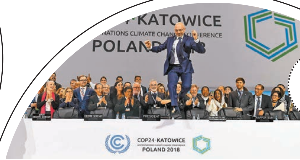
■ COP24 主席滿意會議成果，興奮得跳起。

波蘭卡托維茲舉行的《聯合國氣候變化框架公約》第24次締約方會議(COP24)前日閉幕，近200個國家的與會代表就《巴黎協定》實施機制及細則等達成協議，同意在測量溫室氣體排放量和監察氣候政策方面遵從相同的規則手冊。雖然美國總統特朗普去年宣佈退出《巴黎協定》，但美國代表仍然插手制訂實施細則，並與沙特阿拉伯和俄羅斯等聯手，反對向聯合國氣候變化報告表示「歡迎」。美國退群引發的「特朗普效應」亦影響了會議過程，巴西和土耳其等國家都以保障本國利益優先為由，提出不同訴求，導致多項議題未能達成共識。