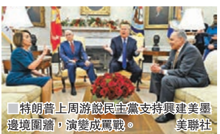
■ 特朗普上周游說民主黨支持興建美墨邊境圍牆，演變成罵戰。

伍軍人事務部及衛生及公共服務部等，但其餘25%則將於本周五午夜結束，包括內政部、財政部、房屋部門及國土安全部等，一旦停擺，全國210萬公務員中，將有約80萬名會受影響，其中40%會被迫放無薪假，其餘60%由於屬必要崗位，因此仍須在無薪下繼續工作。