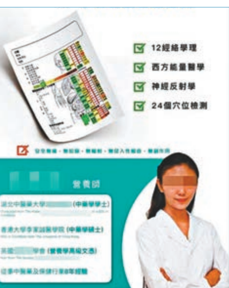
在社交平台帖文內，附有被稱女中醫的相片及列出多項學歷資格。

研究所聯席所長兼本港內科腫瘤專科醫生邵祖德坦言，肽只是由氨基酸組成，不同的肽功能各異，「佢（黃小姐）所講嘅肽究竟係邊一種，同點樣提煉出嚟，都完全冇解釋到。」邵亦質疑肽可改善「亞健康」及減低患癌風險之說，因肽只是消化食物過程中所產生，並不可帶走自由基。中大呼吸系統科講座教授許樹昌亦說：「肽只係普通蛋白質，唔會飲完15分鐘，肺部功能有明顯改善。」並稱該儀器沒有科學根據。立法會議員容海恩則指，如公司產品與事實不符可能會干犯《商品說明條例》。衛生署發言人表示，在2016年至2017年，由署方轉介予警方或協助警方調查懷疑非法作中醫執業個案為94宗。一經定罪，可罰款100,000元及監禁3年。