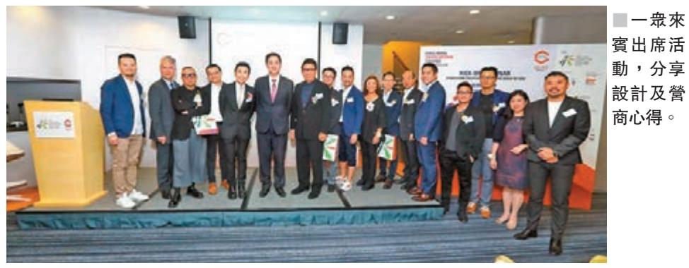
一眾來賓出席活動，分享設計及營商心得。

香港智營設計大賞2019頒獎典禮將於2019年4月15日舉行，本年度大賞更會涵蓋至「玩具及遊戲產品」、「禮品、家居及家居用品」類別，讓更多設計界人才參加。