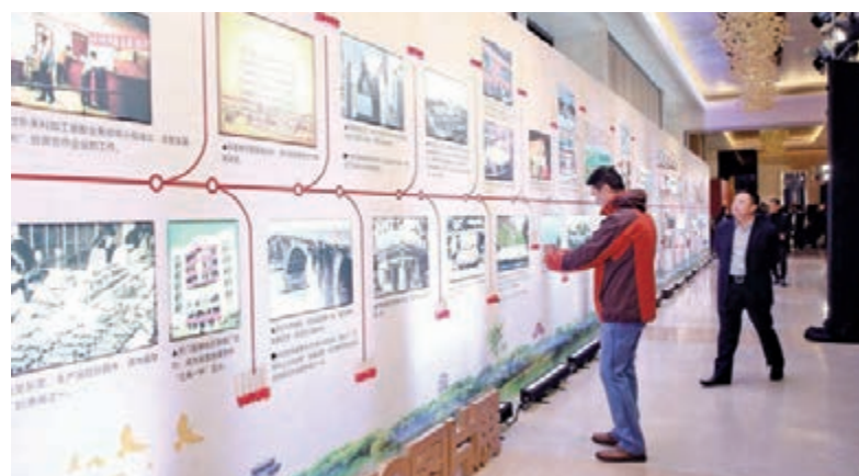
■與會嘉賓參觀東莞40年變遷圖片展。

同時，梁維東希望，廣大莞商不忘家國情懷，做實現中華民族偉大復興的「追夢者」；踐行新發展理念，做推動高質量發展的「頂樑柱」；強化共享發展責任擔當，做義利並重、富而思報的「愛鄉人」。東莞將積極構建「親」「清」新型政商關係，繼續秉持親商、安商、穩商、富商的理念，努力打造更加開放公平的營商環境，為企業發展保駕護航；努力提高政府工作效能，當好大家的「娘家人」；努力助推莞商做強做大，與海內外莞商攜手共創更加美好的明天。