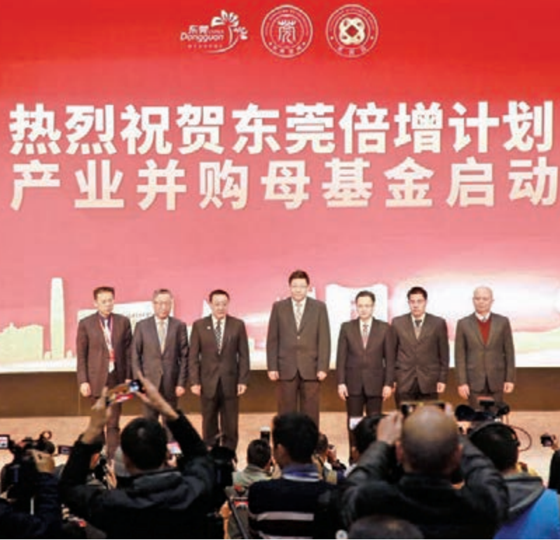
■在世界莞商資本峰會上，東莞產業併購母基金正式啟動。