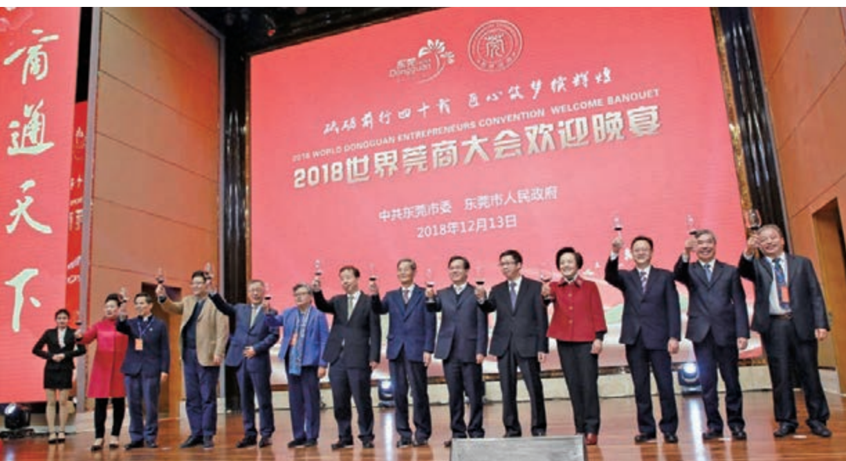
■13日晚，東莞市為出席2018世界莞商大會的嘉賓舉行歡迎晚宴。