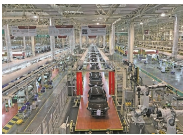
■從東莞製造到東莞智造，許多莞商在推進國內合作共贏發展的同時，積極融入經濟全球化浪潮。

會上還舉行了項目簽約儀式。由世界莞商聯合會（簡稱「莞商會」）、東莞民營投資集團（簡稱「莞民投」）主導的12個項目在現場集中簽約。這些簽約項目包括莞民投總部大樓項目、4個產業投資類項目、2個科技金融服務項目、5個基金投資類項目，項目涵蓋新型智能產業發展、地標性總部、城市更新發展、交通綜合體改造、股權基金投資、產業併購投資、中小企業科技金融服務等，企業總部和產業投資項目規模超270億元（人民幣，下同）、股權基金投資項目約35億元、中小企業金融服務授信額度達200億元。