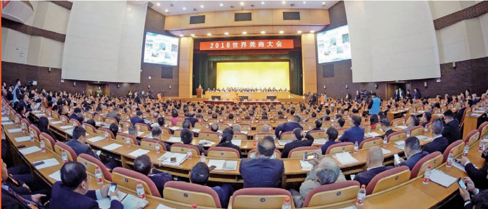
■2018世界莞商大會14日舉行，1,200名海內外嘉賓共同獻良策、覓商機。

世界莞商大會是全球莞商的雙年盛會，是東莞規模最大、規格最高、影響力最強的莞商活動。當前，東莞正緊緊抓住「一帶一路」建設和粵港澳大灣區建設的重大歷史契機，加快向創新型一線城市挺進，與會嘉賓也圍繞這一主題共同獻良策、覓商機。