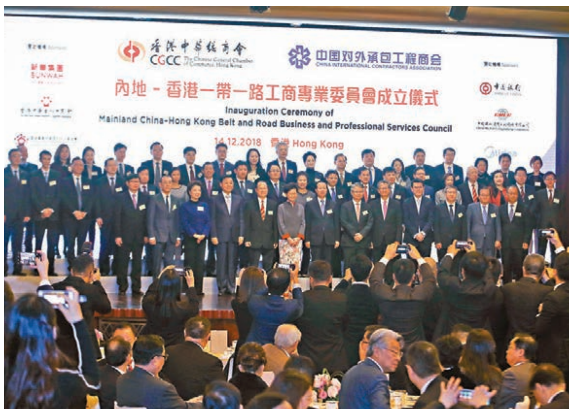
■香港中華總商會與中國對外承包工程商會成立內地—香港「一帶一路」工商專業委員會儀式。出席嘉賓合影。

香港文匯報訊(記者 費小燁)為積極響應「一帶一路」倡議,並進一步加強內地與香港企業緊密合作,香港中華總商會與中國對外承包工程商會牽頭成立「內地—香港一帶一路工商專業委員會」,並於昨日舉行成立儀式。