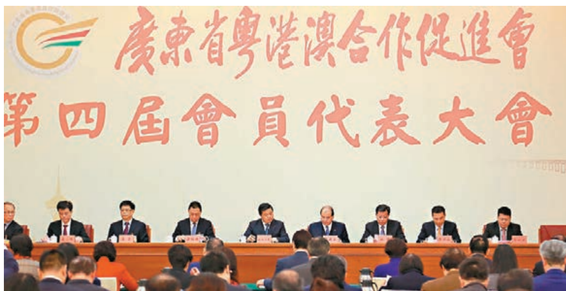
■張建宗在穗出席粵港澳合作促進會。

委員會內地地方秘書長、承包商會會長房秋晨表示,委員會今後將全力以赴,為兩地企業開展實務合作提供專業化服務,搭建高效交流平台,並為內地與香港實現優勢互補、互利共贏營造廣闊的發展空間。