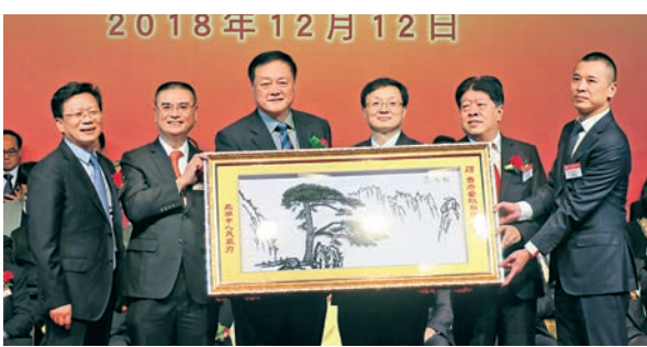
■安徽省蕪湖市長賀懋燮代表蕪湖市政府致贈紀念品