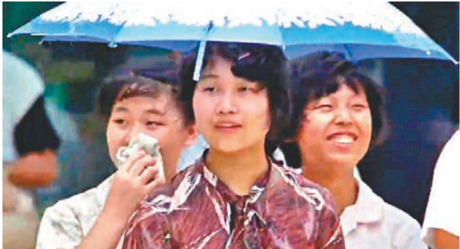
蛇口工業區建設者。 視頻截圖

則開展農村改革、國企改革以及搞活全國私營經濟。值得關注的是，片中大量珍貴的畫面重現改革開放總設計師鄧小平兩度視察深圳，「中國只要不搞社會主義，不搞改革開放發展經濟，不逐步地改善人民生活，走任何一條路都是死路」的鄧小平