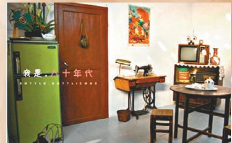
上世紀八九十年代，家庭「三大件」變成冰箱、洗衣機和彩色電視機。