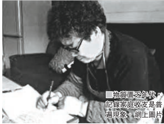
物質匱乏年代，記錄家庭收支是普遍現象。