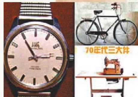
改革開放初期，手錶、自行車和縫紉機是家庭必備「三大件」。