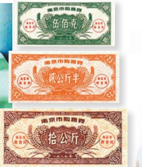
南京市糧票。 網上圖片