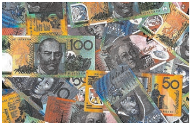
■ 中美官員仍在進行貿易磋商，幫助緩和英國退歐亂局帶來的衝擊，支持澳元走穩。圖為澳元鈔票。 資料圖片