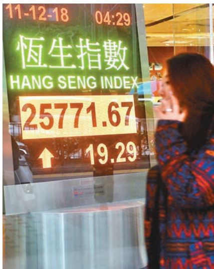
■ 中美貿易代表通電話，略為紓緩市場憂慮，恒指昨微升19點，結束四連跌，成交大減至653億元。 中通社

香港文匯報訊(記者 周紹基)中美貿易代表通電話，略為紓緩市場憂慮，恒指昨日最多升過109點，但逼近50天線有阻力，曾一度倒跌109點，最終收報25,772點，微升19點，結束四連跌，成交大減至653億元，反映市場仍然觀望貿易戰及華為等事件的進展。早前累積跌幅大的藥股，多隻股份終見反彈，濠賭股亦跑贏大市，但金融股繼續弱勢。