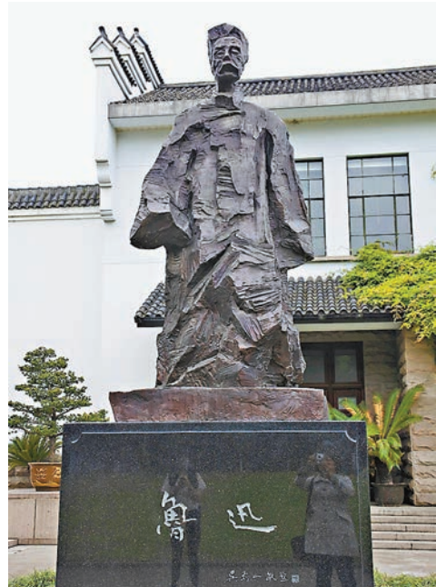
魯迅反對傳統婚姻，一直冷待元配夫人。資料圖片

魯迅的婚戀故事下集還有很多值得注意的地方。究竟他如何處理元配夫人？作為一個負責任的男人，他決定與許廣平開展關係時曾有多少個內心小劇場？凡此種種都靠大家好好認識魯迅生平了。