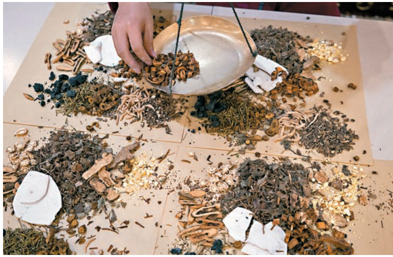
中藥可能會帶有毒性，所以古時要以真人來試藥。資料圖片 精神發揮到更大的層面，才是我們重看二十四孝故事的價值。下一次再和大家分享其餘二十四孝的故事，希望諸君能從中有所啟發。

古人行孝的故事除了具教化作用，也提醒人們行孝的重要性。今天我們重看這些故事時，當然不能以今天的社會發展去判斷他們是否恰當。但我們可以由這些故事反思他們當中的哪些精神仍值得我們今天借鑒，甚至將其擴而充之，把孝的