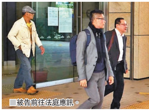
被告前往法庭應訊。