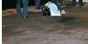
警員在現場岸邊檢獲懷疑墮海港大情侶個人物品。