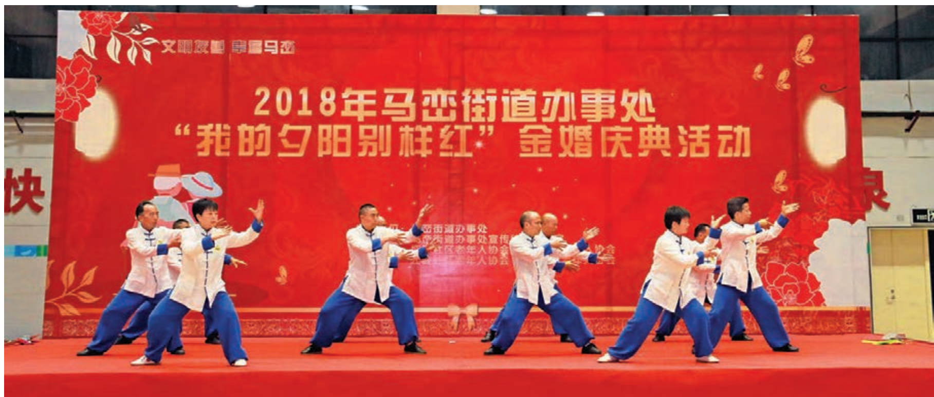
「我的夕陽別樣紅」金婚慶典活動

11月29日，「沁潤書香·引領成長」讀書月活動頒獎儀式在中山中學舉行。本次活動為馬巒街道2018年讀書月系列活動之一，從11月中旬啓動，歷時半個多月。其間，由街道和學校共同出資在校園內建造了一座別致高雅的「三味書屋」，並為學生購買了1000餘本經典文叢和主題讀本。這，只是馬巒街道文化建設的一個縮