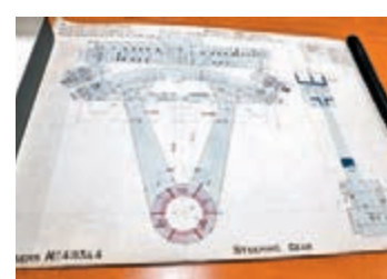
致遠艦設計圖之一

兩米長的淡黃色亞麻紙已褶皺卷邊，圖紙上意為「巡洋艦編號493和494」的字跡工整、墨跡清晰、塵封百年。甲午海戰中抗擊日艦後沉沒的遠東艦隊旗艦致遠艦的部分原廠設計圖紙在其建造地——英國紐卡斯爾市的一家檔案館，首次被發現，為打撈那段悲壯的歷史提供了重要參考。