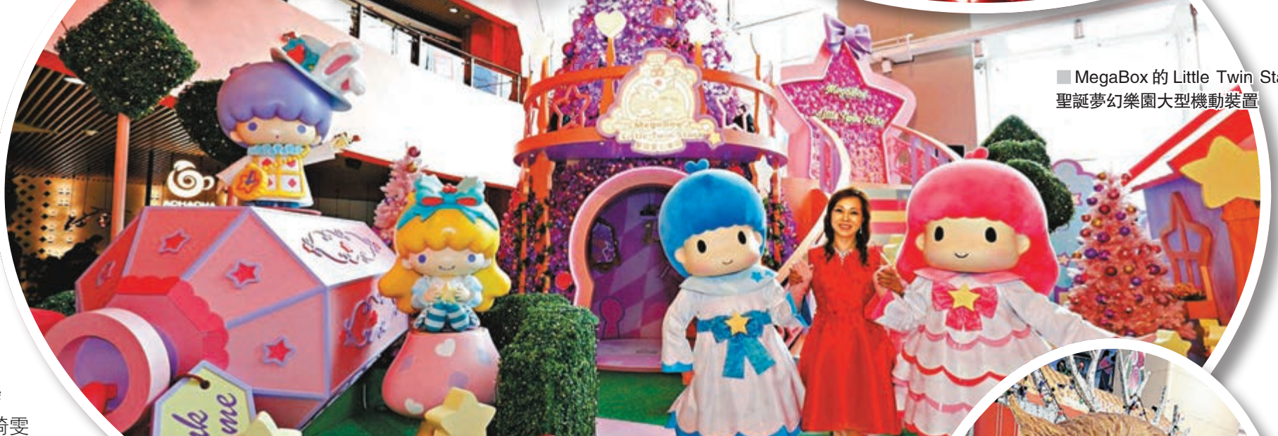
■MegaBox的Little Twin Stars聖誕夢幻樂園大型機動裝置