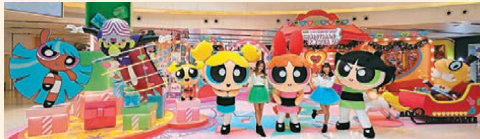
■Mikiki x 飛天小女警「Christmas Power Up!」