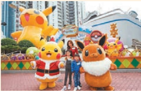
■七米半高巨型充氣皮卡超登陸「黃埔號」