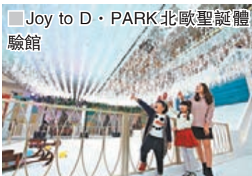
■Joy to D·PARK北歐聖誕體驗館

apm則與英國人氣潮流插畫師Alice Tams合作，融入藝術、音樂、聲控、燈光和數碼技術元素，打造6,000呎的「apm聖誕冰雪樂園」裝飾，藉機宣揚愛護動物及大自然的訊息。