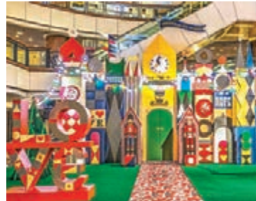
■海港城Christmas to Joy