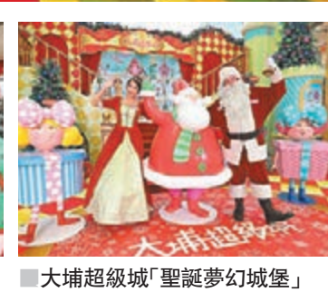
■大埔超級城「聖誕夢幻城堡」