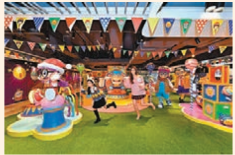
■life@KCC「IQ博士×珍寶珠反斗馬戲團」

而迪士尼Tsum Tsum則現身朗豪坊，Tsum Tsum米奇以全新的聖誕老人造型聯同米妮、小熊維尼、唐老鴨、勞蘇、史迪仔及三眼仔等一大班好友，打造全港首個迪士尼「Tsum Tsum聖誕市集」，並設期間限定店推出超過700款限定商品。