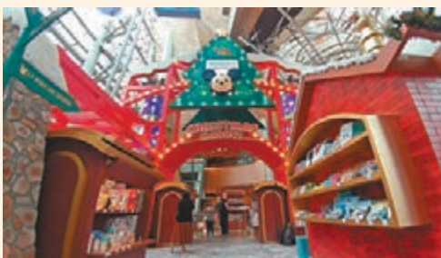
■朗豪坊「迪士尼Tsum Tsum聖誕市集」