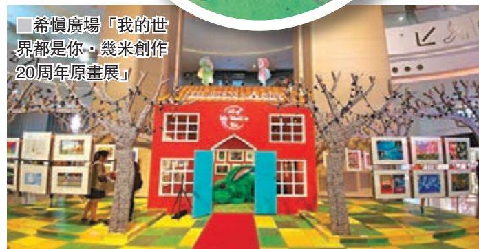
■希慎廣場「我的世界都是你」幾米創作20周年原畫展