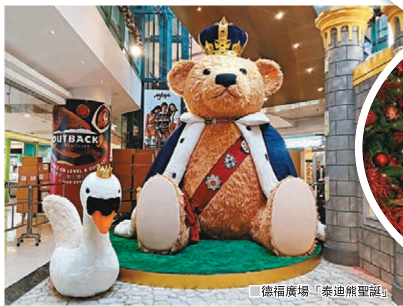
■德福廣場「泰迪熊聖誕」