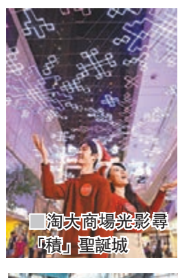
■淘大商場光影尋「積」聖誕城

新城市廣場則以唯美的數碼互動藝術裝置全新詮釋《愛麗絲夢遊仙境》文學經典，於7樓星光花園則以《愛麗絲夢遊仙境：穿越魔鏡》為設計靈感，把多個夢幻景點、疑似真神秘可愛的人和物，配合魔幻光影光效，打造出可媲美「天空之鏡」的仙境。