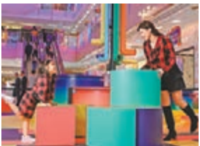
■K11「Christmas Art Playground」

而海港城則邀請了來自英國的著名積木玩具設計組合Miller Goodman，重新演繹《胡桃夾子》這個經典故事，將整個商場化身成一個個互動故事場景，如港威商場中庭的15尺高積木城堡。