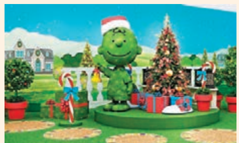
■Harbour North北角匯《花生漫畫》角色園藝主題裝置