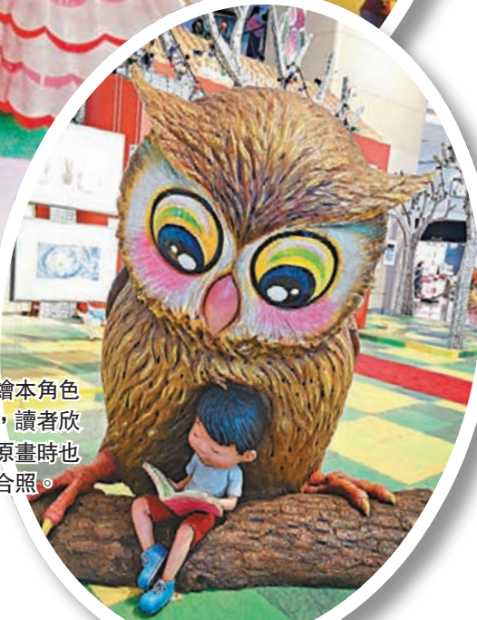
■幾米繪本角色立體化，讀者欣賞繪本原畫時也可與之合照。