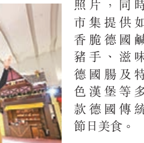
■德國主題聖誕市集

另外，德國聖誕市集乃全球冬日旅遊必玩的景點之一，今年德福廣場為大家帶來夢幻的德國主題聖誕市集，可於5.2米高巨型德國風車蠟燭台裝置大拍溫馨照片，同時市集提供如香脆德國鹹豬手、滋味德國腸及特色漢堡等多款德國傳統節日美食。