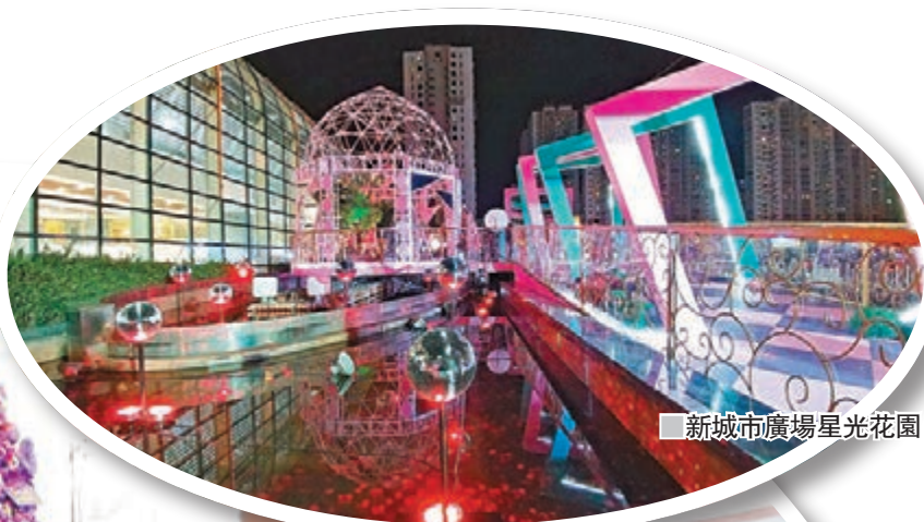
■新城市廣場星光花園