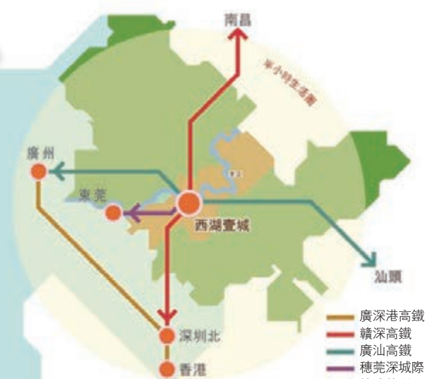
■ 「西湖壹城」坐落於粵港澳大灣區東部交通樞紐城市惠州，位處惠州市的商業中心黃金地段。