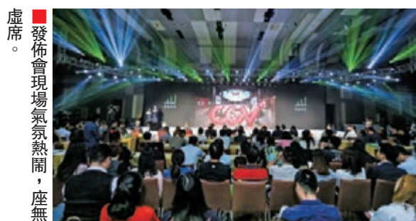
■ 發佈會現場氣氛熱烈，座無虛席。