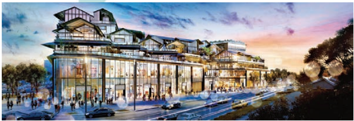
■ 「西湖壹城」坐落於粵港澳大灣區東部交通樞紐城市惠州，縱覽西湖5A旅遊景觀。