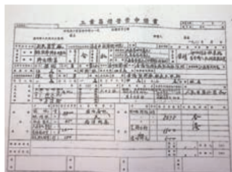
林亮1948年回廣州開玩具廠的申請書。