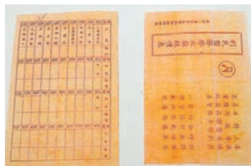
當年製造小黃鴨的報價表。