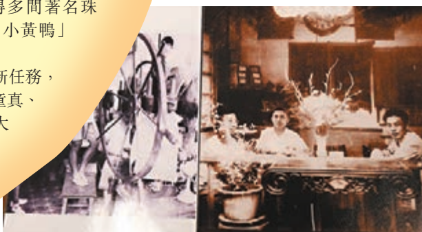
1948年廣州廠的負責人和「古董」機器。