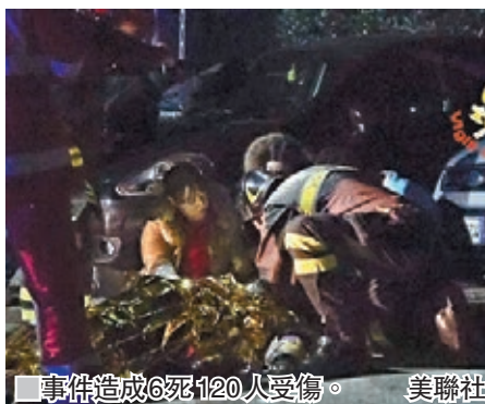
事件造成6死120人受傷。