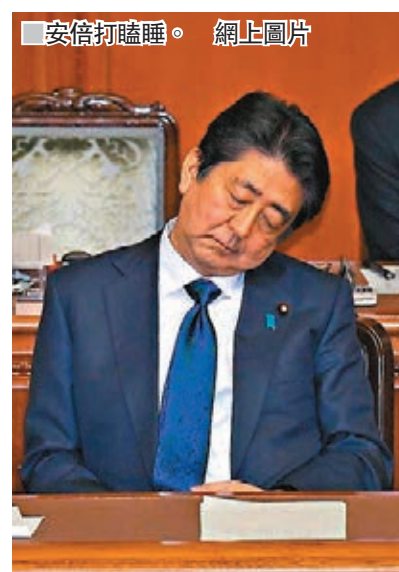
安倍打瞌睡。