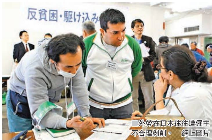
外勞在日本往往遭僱主不合理剝削。