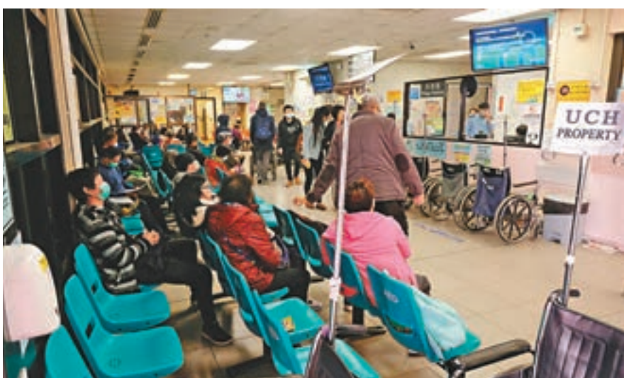
▲求診人數大幅減少,但病人輪候時間不減反增。圖為聯合醫院急症室。資料圖片