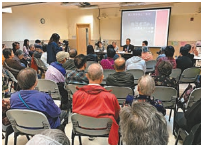
▲關注長者權益大聯盟舉辦《無牙老苦 II》。

大聯盟指出,大部分長者退休後的經濟狀況,未能負擔昂貴的牙科診療費用,若只有單次性的牙科津貼項目,實難保障長者的牙齒健康,建議關愛基金逐步放寬「長者牙科服務資助計劃」至60歲非領取長者生活津貼的長者,進一步擴闊受惠者層面;全港18區最少設有一所政府牙科街診所,提供全套牙科服務;及由政府向全港市民提供全面牙科教育。