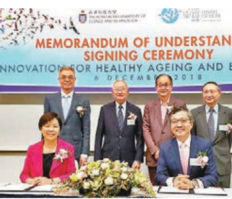
科大研「虛擬治療師」監測老友記健康狀況。