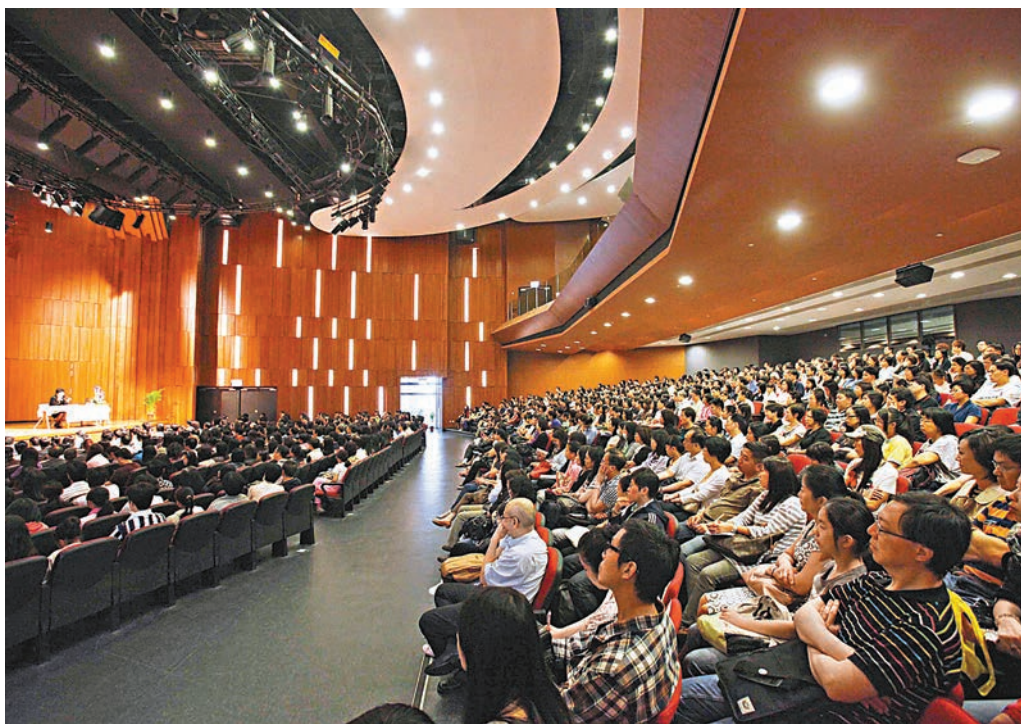
全港升中人數反彈。英中入學平均3人爭1額。圖為女拔萃中一收生簡介會。

香港文匯報訊（記者 詹漢基）升中人數自去年開始回升，教育局預計，參加2019年度中一派位學生約有53,600名，較今年大增約3,300人。教局為提供足夠學額，會讓過去幾年的「減派」措施於下學年起逐步「復位」，全港中一每班增派至31人，而個別需求較大的地區也會「擴班」共計35班。針對最受家長青睞的英文中學，明年全港中一學額亦增加近500個至約1.76萬個，不過對比人口增長仍有不及，英中入學平均3人爭1額，較今年更為激烈。