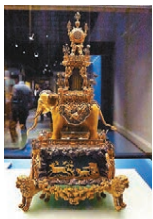
銅鍍金象馱水法錶。