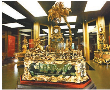
銅鍍金獅村景色法鐘。香港文匯報記者 曾慶威 攝