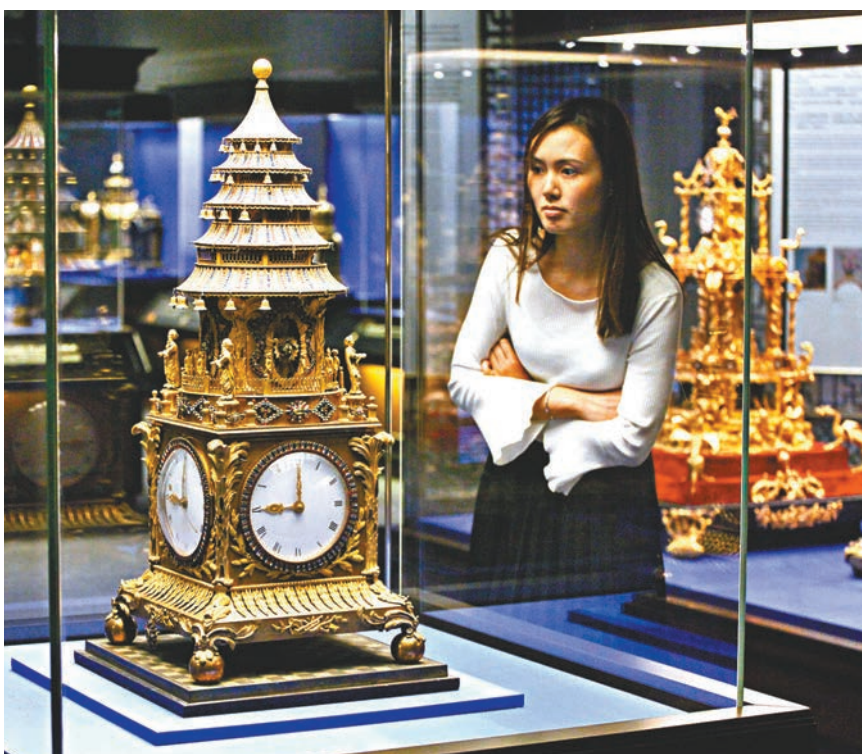
銅鍍金嵌料石轉人升降塔鐘。