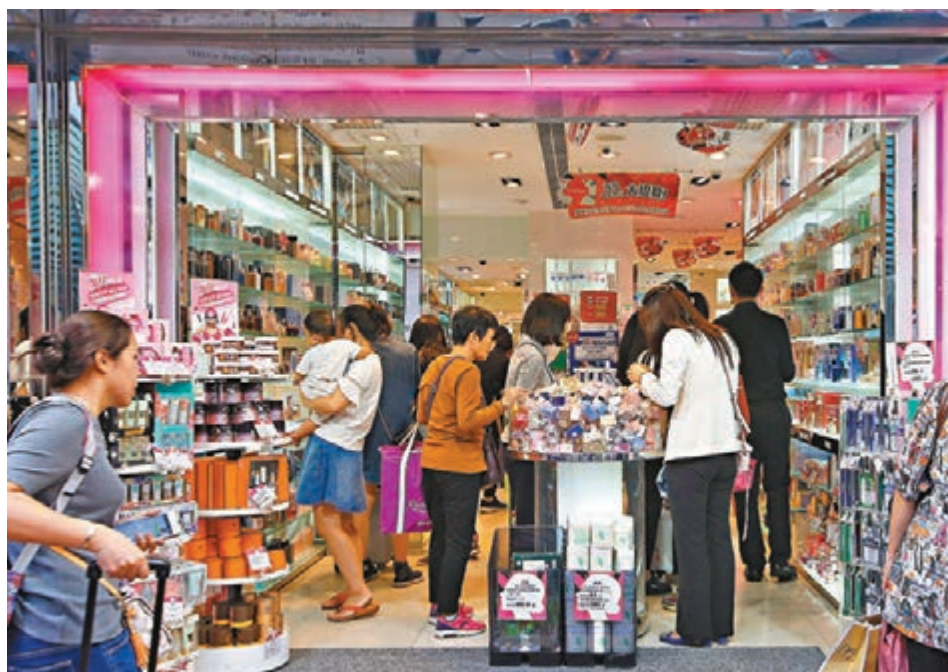
香港護膚品、珠寶、名錶在11個城市大排名分別第11位、第10位和第8位,表明香港有關產品價格在亞洲相對便宜。資料圖片

更有意思的是,報告新增了「他」和「她」指數,將男女奢侈品消費分開來計,雅加達和孟買分別稱為男、女奢侈品最便宜的城市,香港無論性別都極具競爭力,能排名第三便宜。而港人出遊勝地首爾、東京、台北,在奢侈品方面競爭力微弱,首爾更因為對進口奢侈品徵收20%的特別消費稅,成亞洲最貴的城市。該報告還稱,平均來說購買「她」指數中的商品要比「他」指數中的商品多花費2,158美元。