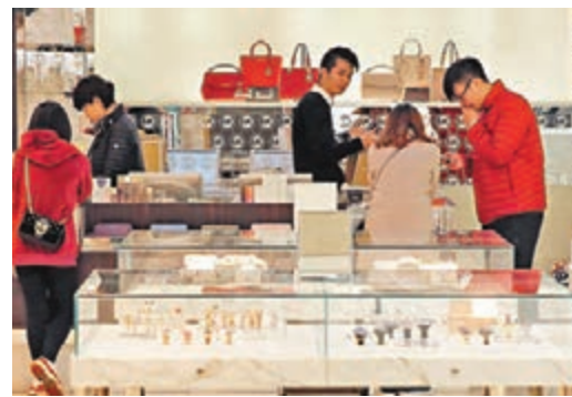
據貝思公司數據,內地奢侈品消費在全球中佔據三分之一。

不過報告補充指,即便如此,由於家庭收支狀況穩健,短期住宅市場(尤其是高端市場)供應不足,預計香港的房地產價格不會大幅下跌。