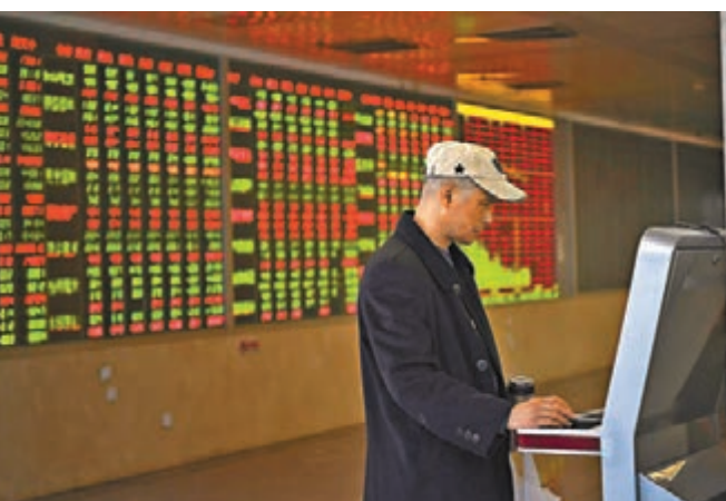
■ 內地股市昨日早段回吐壓力大,幸午後板塊發力。

天信投顧分析,整體來看,昨日市場多空雙方反覆爭奪,個股活躍度並未受到影響,呈現明確的賺錢效應,料短期市場將繼續向2,700點整數關口邁進。巨景投顧同樣認為,短期隨着資金面和技術面積極轉好,利於行情繼續上行,大盤有望衝擊2,700點壓力平台。前海開源基金首席經濟學家楊德龍認為,周二A股出現了一定的震盪,