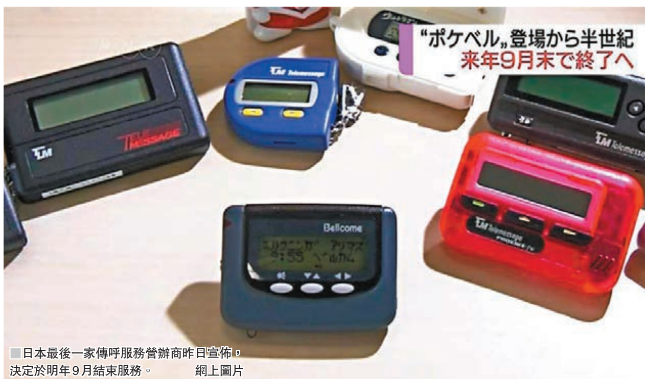
■日本最後一家傳呼服務營辦商昨日宣佈，決定於明年9月結束服務。

不過一些網民則對傳呼機仍然存在感到驚訝，較年輕的網民甚至說「沒見過也沒用過」。 ■綜合報道