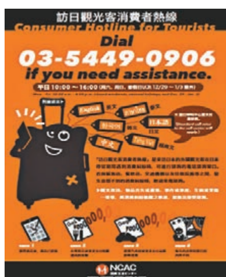
■「訪日觀光客消費者熱線」海報。