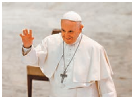
■方濟各本週出版新書。路透社

新書《神召的力量》(The Strength of Vocation, 暫譯)以專訪形式寫成，討論當今神職人員面臨的困難，將以數種不同語言發行。 ■路透社