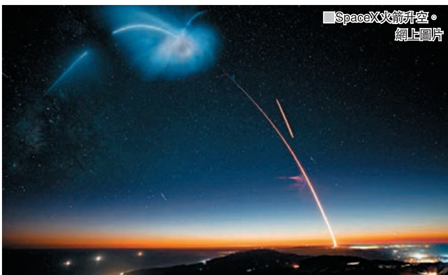
■SpaceX火箭升空。網上圖片

部分，會同時將64枚小型衛星送上太空，同時亦將刷新SpaceX多項紀錄，包括同一具「獵鷹9」號使用次數首次達第3次、SpaceX今年升空次數達19次。 ■綜合報道