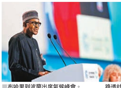
■布哈里到波蘭出席氣候峰會。

尼日利亞總統布哈里去年曾經到英國留醫5個月，由於他沒有公佈病情，引致流言四起，網上更有人宣稱其實布哈里早已逝世，當前的布哈里只是來自蘇丹的替身。布哈里前日到波蘭出席氣候峰會時公開反駁傳言，表示「這真的是我，我可以向你保證。我即將慶祝76歲生日，且會變得更強壯」。布哈里正爭取明年2月大選中