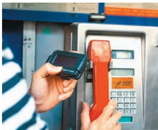
■香港在1990年代初步入黃金時代。