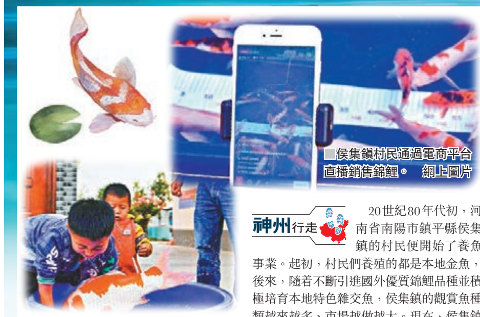
侯集鎮村民通過電商平台直播銷售錦鯉。網上圖片