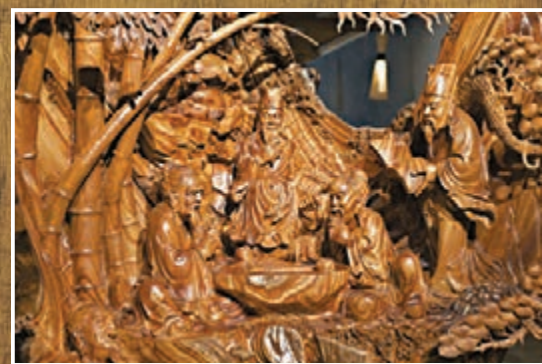
俞有桂作品《竹林七賢》細節。