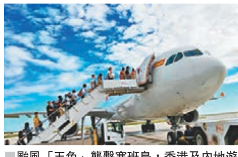
颱風「玉兔」襲擊塞班島，香港及內地遊客安全登機撤離。

筆者作為此次接返工作的參與者，親身感受到了香港同胞對內地同胞的親情。身處異國他鄉，面對危險困境，親情更加濃烈，血濃於水。無論是特區政府入境處還是兩家航空公司，都全力以赴、加班加點地投入到此次塞班接返工作中。香港快運航空