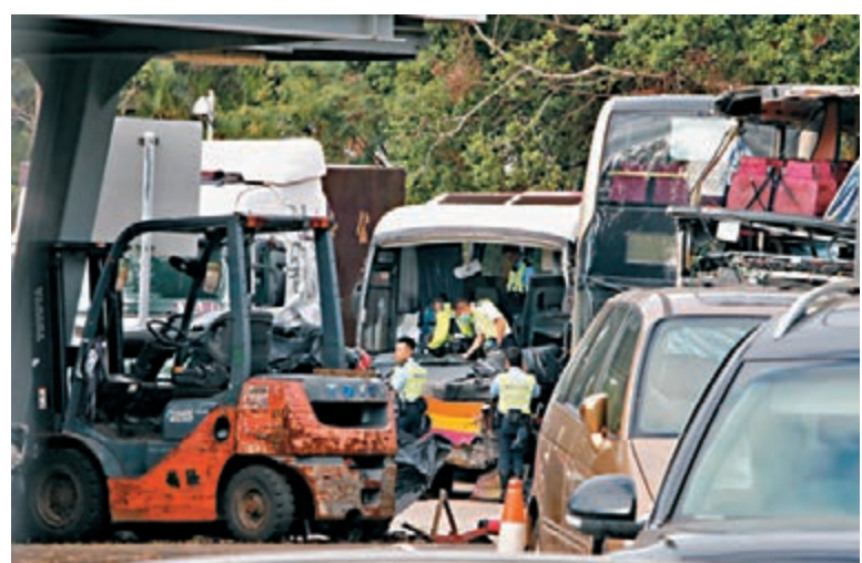
■青衣上周發生致命車禍，釀5死32人傷。

陳帆昨日出席立法會會議後與傳媒會面時表示，對於在青衣發生的嚴重交通事故，感到非常難過，他向死者和傷者的家屬致以深切慰