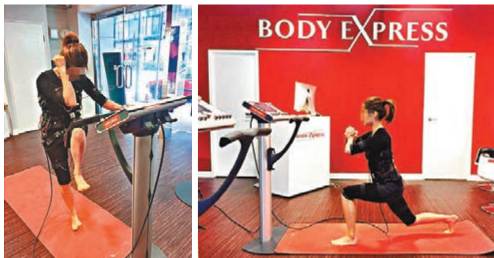
facebook專頁聲稱，EMS訓練能加強腰背肌等功效。