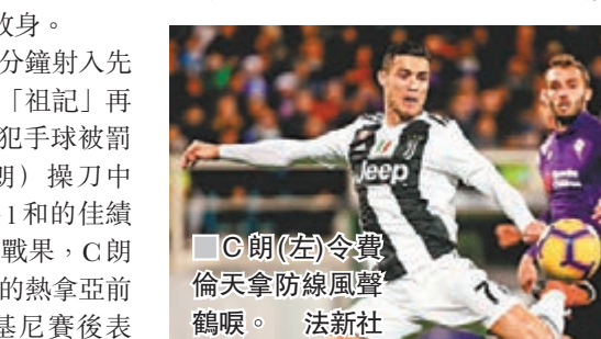
C朗(左)令費倫天拿防線風聲鶴唳。