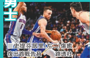
史提芬居里(左二)傷癒復出首戰告負。