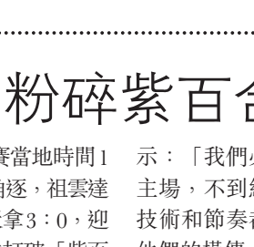
高圖爾斯今仗力保不失。