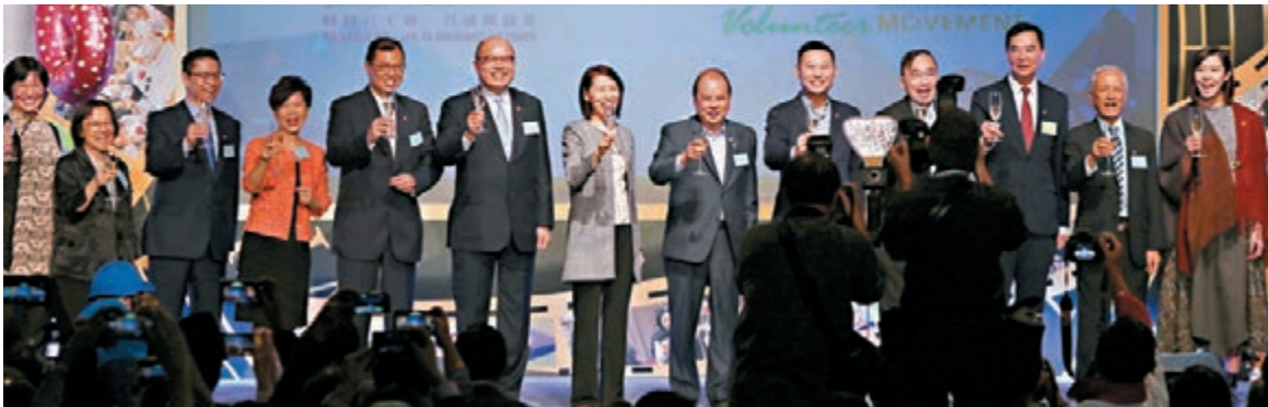
■ 2018香港義工嘉許典禮。