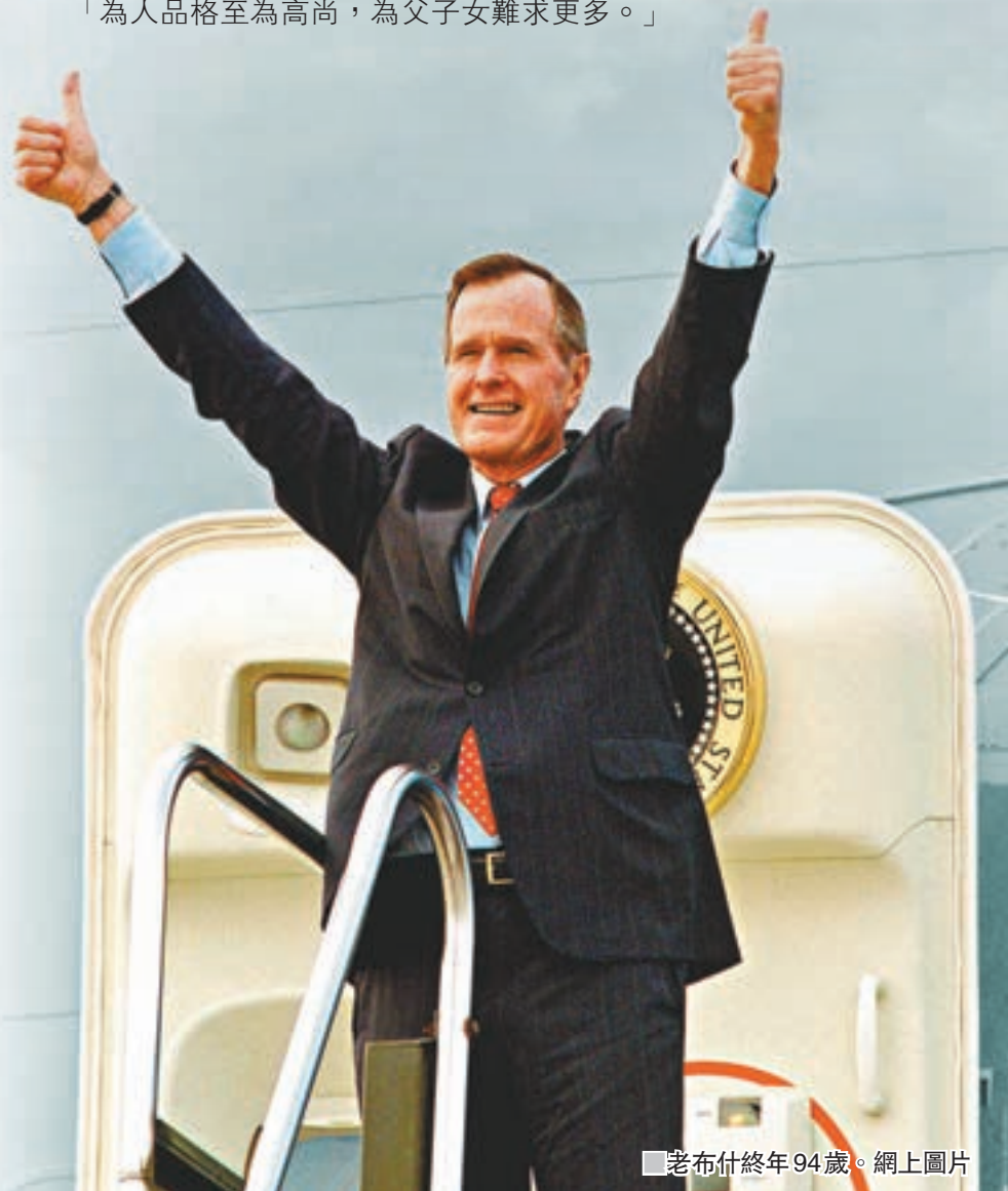
老布什終年94歲。

由二戰中被日軍擊落，到派駐北京擔任駐華聯絡處主任，再光榮入主白宮，一生充滿傳奇的美國第41任總統老布什，前日以94歲高齡告別人世，與今年初先走一步的夫人芭芭拉在天國重聚。雖然老布什只當過一屆4年的總統，但他重視多邊合作、務實的外交路線，不但讓美國以至全球安然度過蘇聯解體後的動盪年代，更為後來者立下重要榜樣，在當前美國大搞單邊主義的政治環境看來甚是難能可貴。老布什卸任後民望不跌反升，耄耋之年仍然致力人道工作，備受朝野各方推崇。老布什長子、第43任美國總統布希以簡單一句總結父親一生：「為人格格至為高尚，為父子女難求更多。」