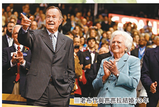
老布什與芭芭拉結婚73年