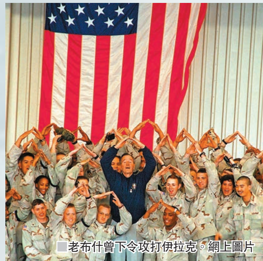
老布什曾下令攻打伊拉克。

老布什發言人麥格拉思發表聲明表示，老布什於美國中部時間前晚10時10分(香港時間昨午12時10分)逝世，聲明未有透露死因，但老布什老年患上帕金森症，今年4月芭芭拉逝世後，他又先後因為血液感染和低血壓入院，此後未再公開露面。