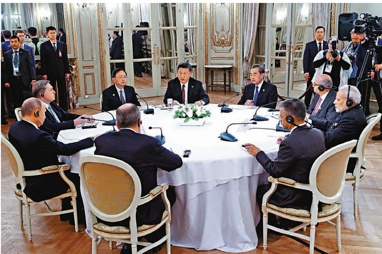
當地時間11月30日，中國國家主席習近平在布宜諾斯艾利斯出席中俄印領導人非正式會晤。習近平同俄羅斯總統普京、印度總理莫迪就新形势下中俄印合作深入交換意見。