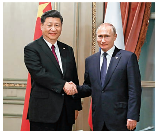
當地時間11月30日，中國國家主席習近平在布宜諾斯艾利斯會見俄羅斯總統普京。

香港文匯報訊 據新華社報道，當地時間11月30日，國家主席習近平在布宜諾斯艾利斯會見俄羅斯總統普京。