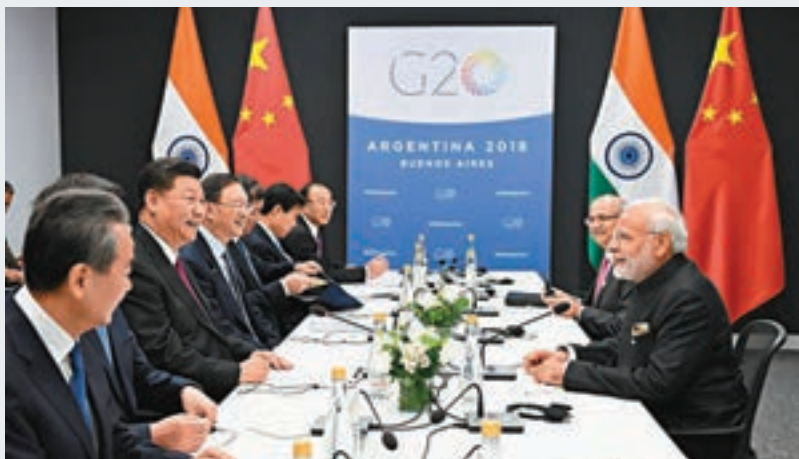
當地時間11月30日，中國國家主席習近平在布宜諾斯艾利斯會見印度總理莫迪。

習近平指出，當前，世界經濟面臨的風險挑戰加劇。中印雙方應加強協調合作，共同妥善應對。我們