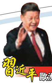
習近平 歐洲中南美行

香港文匯報訊 據新華社報道，當地時間11月30日，中國國家主席習近平在阿根廷布宜諾斯艾利斯出席中俄印領導人非正式會晤。習近平同俄羅斯總統普京、印度總理莫迪就新形势下中俄印合作深入交換意見。三國領導人一致同意加強三方協調，凝聚三方共識，增進三方合作，共同促進世界的和平、穩定、發展。