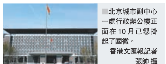
北京城市副中心一處行政辦公樓正面在10月已懸掛起了國徽。

香港文匯報訊(記者 張聰、張帥 北京報道) 隨着北京城市副中心行政辦公區一期主體工程基本具備入住條件，副中心行政辦公區正式啟動。據悉，近日北京市扶貧支援辦、北京市直機關工委、北京市保密局、共青團市委等部門已遷入北京城市副中心行政辦公區辦公，部分市級部門也將陸續遷入辦公。對於下一批市級部門遷入的具體時間，香港文匯報從知情人處獲悉，最快可能於12月中旬進行。昨日，除副中心行政辦公區外，香港文匯報記者還走訪了城市副中心的多個正在建設的文化設施，在副中心範圍內的通州文化旅游區，最受關注的環球主題公園主體工程也將在今年底動工。