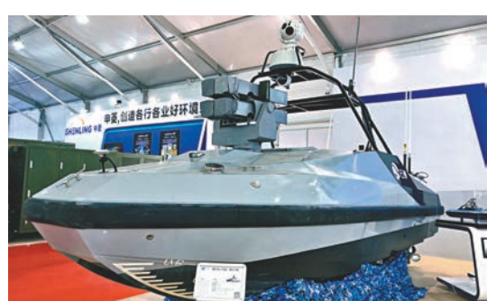
圖為無人導彈艇。

香港文匯報訊(記者 方俊明 珠海報道) 首屆自主船舶發展(萬山)論壇昨日在珠海舉行，其間珠海萬山無人船海上測試場正式啟用，成為目前全球最大、亞洲首個無人船海上測試場。據了解，該測試場在過去不到一年的準備和試驗期間，先後保障了全球最大規模無人艇集群試驗、全國首次水面無人化衛星定標試驗、全國首次無人導彈艇實彈射擊試驗等。