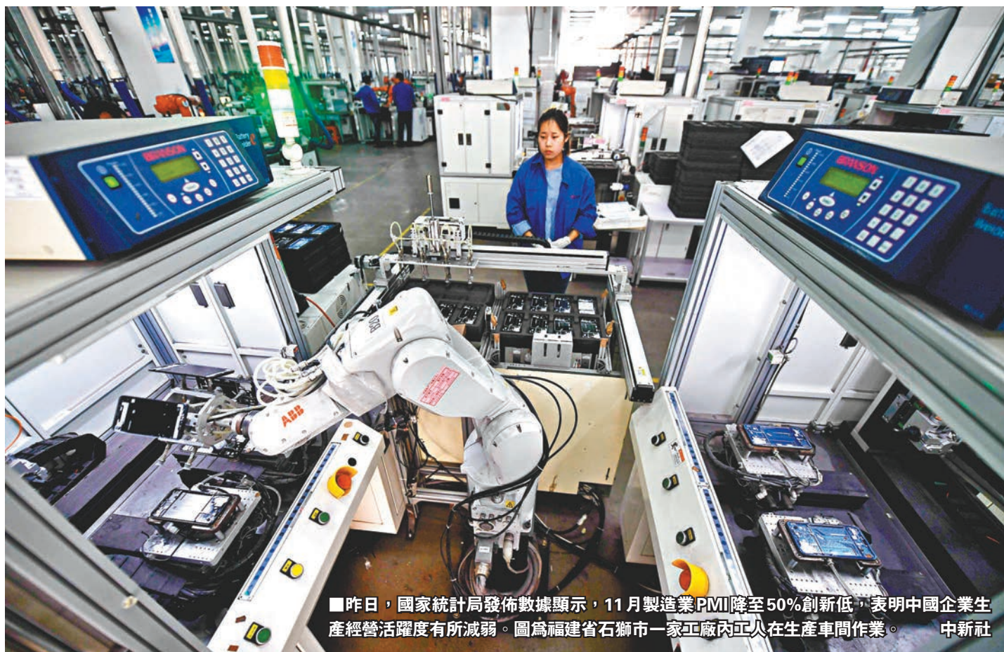
昨日，國家統計局發佈數據顯示，11月製造業PMI降至50%創新低，表明中國企業生產經營活躍度有所減弱。圖為福建省石獅市一家工廠內工人在生產車間作業。

此前製造業PMI已連續27個月處於榮枯分界線以上的擴張區間。數據顯示，11月，製造業產需均出現回落，生產指數為51.9%，比10月微落0.1個點。反映內需的新訂單指數和進口指數分別跌0.4和0.5個百分點，至50.4%和47.1%。反映外需的新出口訂單指數則有所企穩，自46.9%微升至47%；不過受貿易摩擦影響，新出口訂單指數連續六個月處於收縮區間。國家統計局