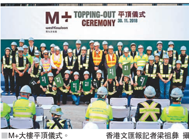
M+大樓平頂儀式。