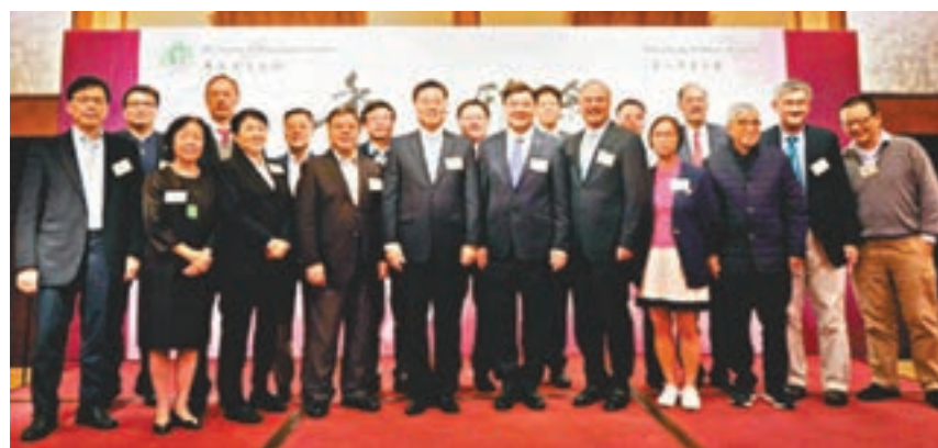
謝鋒應邀出席香港學者協會舉辦的2018年冬季「香江雅敘」。

黃玉山感謝謝鋒和外交部特派員公署對香港高等教育發展的關心和支持,表示謝鋒的報告精彩生動,精闢闡釋了新時代中國特色大國外交的理念,高度概括了2018年國家外交工作的成就,有助於大家全面了解國家外交政策,增強對國家發展的信心。