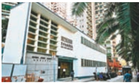
香港新聞博覽館預覽。

和奧運馬術比賽為主題。館內並設有工作坊及小遊戲,讓公眾體驗新聞工作者的工作,例如可扮演主播或模擬新聞控制室內的幕後製作,以及拍照一嘗上頭版的滋味。公眾亦有報紙檔、舊街市攤檔、雞籠房及豬肉枱等