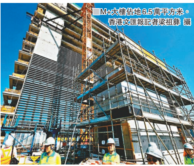
M+大樓佔地6.5萬平方米。

西九管理局行政總裁栢志高說,大樓八成建築工程已完成,整體維修工程則完成六成,仍有內部裝修工作尚待完成,其後需要9個月時間預備才能展出展品,包括檢查大樓的溫度及濕度是否