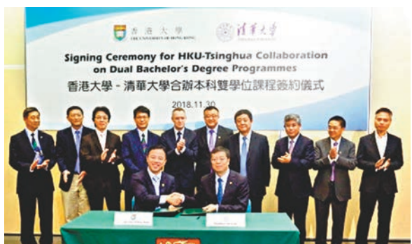
香港大學與清華大學簽署合作備忘錄開辦兩個四年制雙學士學位課程。

對於有政黨指管理局拖欠7間分判商工程款項,栢志高指管理局不會處理承辦商及分判商員工的工作,員工應向其僱主追討。西九管理局已向承辦商及分判商支付工程費用,部分申索個案仍要較長時間進行調查,管理局亦可能會提出申索,預計2021年或2022年完成。