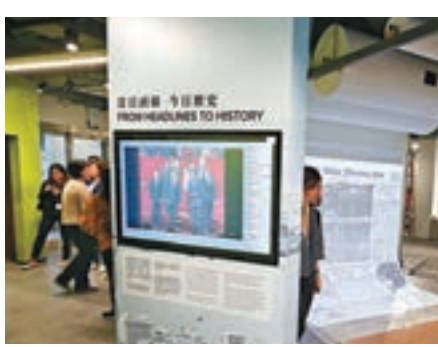
開幕展示往昔新聞事件。

和奧運馬術比賽為主題。館內並設有工作坊及小遊戲,讓公眾體驗新聞工作者的工作,例如可扮演主播或模擬新聞控制室內的幕後製作,以及拍照一嘗上頭版的滋味。公眾亦有報紙檔、舊街市攤檔、雞籠房及豬肉枱等