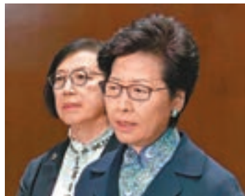
林鄭月娥向死者家屬致以深切慰問。旁為陳肇始。

香港文匯報訊(記者 聶曉輝)奪命交通意外發生後，多名問責官員先後到醫院探望傷者。特區行政長官林鄭月娥對今次造成嚴重傷亡的交通意外感到非常難過，向死者家屬致以深切慰問，同時希望傷者能早日康復，並已要求相關政策局盡快處理事件。行政會議非官守議員、全體建制派立法會議員均對事件深表哀痛及深切哀悼，後者在聲明中更呼籲相關僱主盡量為員工提供協助，及對受傷工人的醫療福利作出必要的承擔。