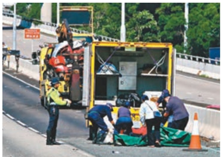
工人在車禍現場昇送死者遺體。

港九勞工社團聯會對今次事件深感難過，期望傷者能盡快康復。勞聯指出，是次車禍受影響者包括該會於機場工作的會員工友，勞聯將全力為工人提供支援，協助他們渡過難關。勞聯並促請政府仔細調查事故，包括調查是否涉及疲勞駕駛等，避免同類事件再次發生。