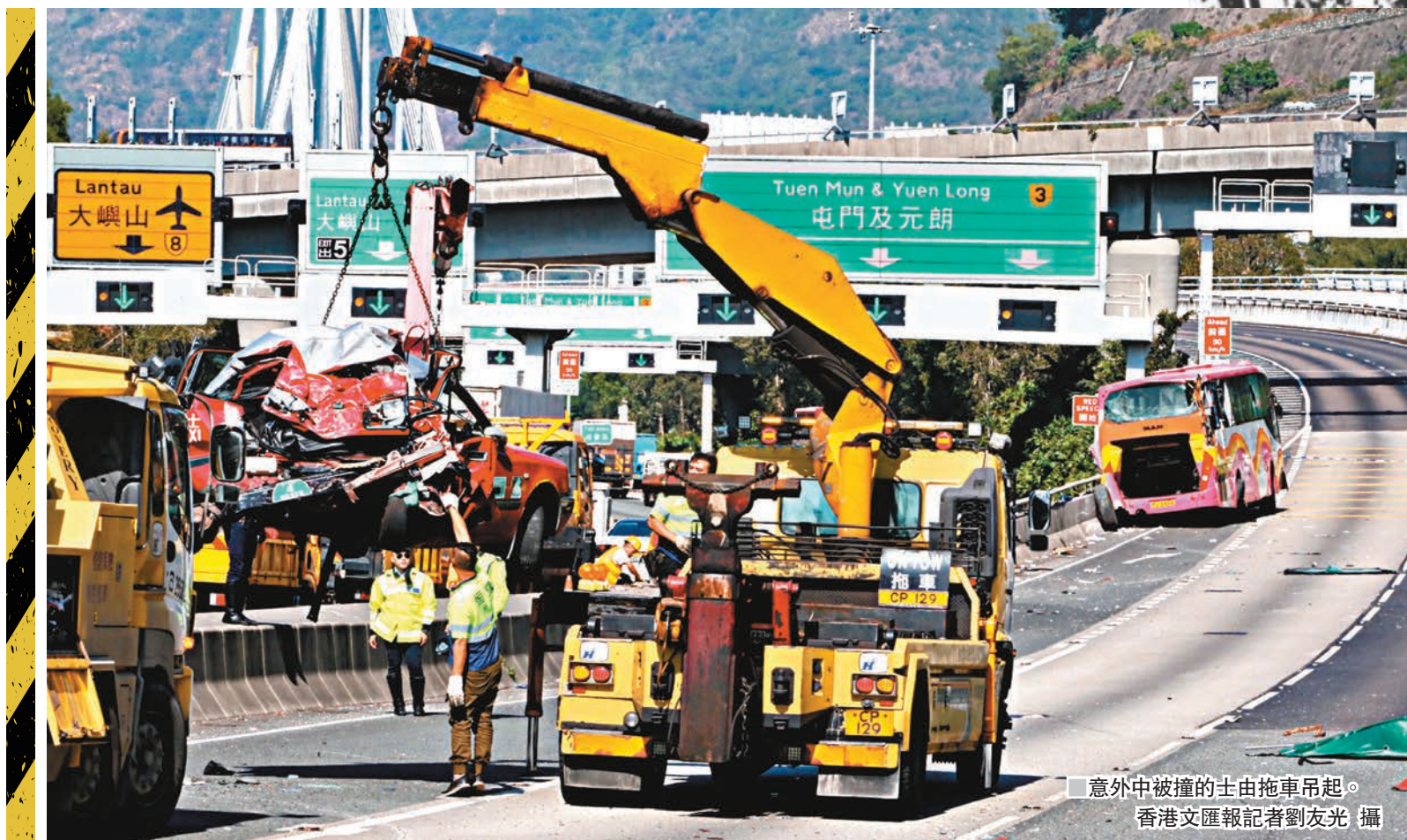
意外中相撞的士由拖車吊起。