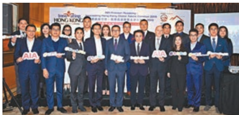
香港國際人才嘉年華將於明年3月舉行，主辦方為活動舉行發佈會。

及企業參與，發展成具影響力的招聘盛會，不僅可鞏固香港具優勢的人才庫，更為粵港澳大灣區進行國際人才儲備，協助青年發展搭建橋樑，為大灣區以至「一帶一路」國家輸入人才，助力推動未來建設發展。