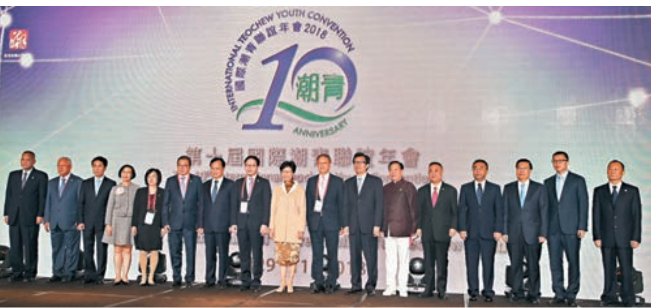
第十屆國際潮青聯誼年會開幕式，賓主合影。

本屆年會主要聚焦創科發展趨勢和大灣區機遇，一連4天的主要活動包括大灣區考察、聯誼年會及《共享經濟·創科論壇》。