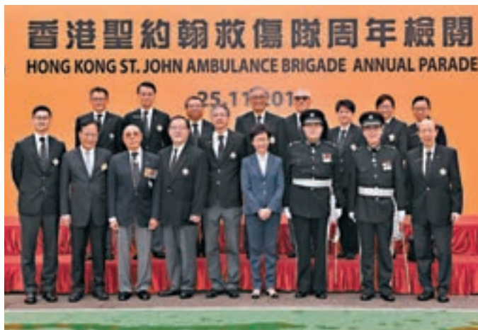
香港聖約翰救傷隊周年檢閱，賓主合照。

年會於1999年在香港舉行首屆會議，其後每兩年於不同國家城市舉行，時隔20載再到香港舉辦，冀一眾國際潮青引領大眾把握機遇，以「共商、共建、共享、共贏」的原則，合力創建未來的共同空間。 ■香港文匯報記者 李攀