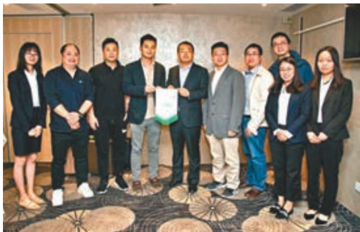
香江聚賢青年部舉辦大灣區青年創業與發展研討座談會。