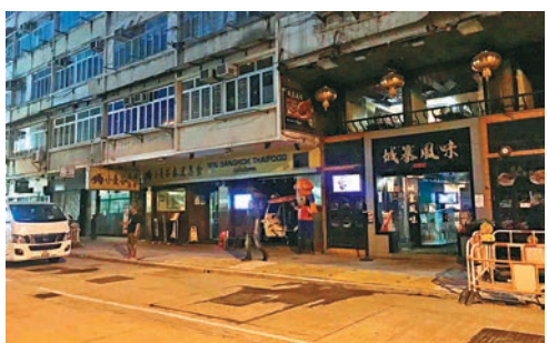
■ 九龍城南角道逾十間商舖昨晚聯合「熄燈」。香港文匯報記者陳珈瑋 攝