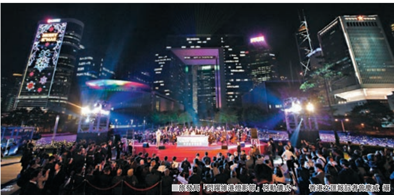
■ 旅發局「閃躍維港燈影節」啟動儀式。