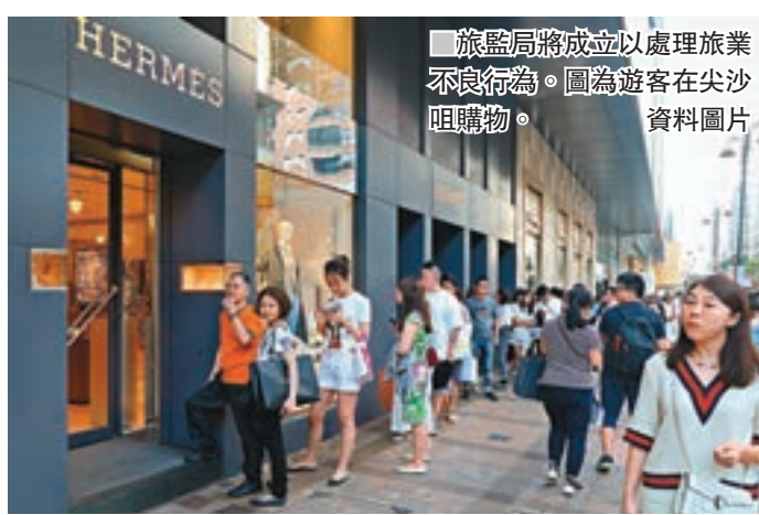
■ 旅監局將成立以處理旅業不良行為。圖為遊客在尖沙咀購物。

修正案最終被否決，《旅遊業條例草案》獲三讀通過。政府會展開下一階段的工作，籌備成立旅監局，並草擬相關的附屬法例，提交立法會審議。旅監局負責發牌並監管旅行代理商、導遊及領隊，包括引入以銀行擔保形式繳存50萬元保證