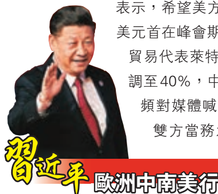
習近平 歐洲中南美行

香港文匯報訊(記者 馬琳 北京報道)二十國集團(G20)領導人第十三次峰會即將在阿根廷首都布宜諾斯艾利斯舉行，其間將舉行的中美元首會晤備受矚目。中國商務部新聞發言人高峰昨日在京表示，希望美方能夠與中方相向而行，努力推動中美元首在峰會期間的會晤取得積極成功。對於美國貿易代表萊特希澤提出要將中國輸美汽車關稅上調至40%，中國外交部發言人耿爽昨日強調，頻頻對媒體喊話、揮舞制裁大棒於事無補。目前雙方當務之急是在相互尊重、平等誠信的基礎上，通過對話協商來解決貿易爭端和存在的問題。