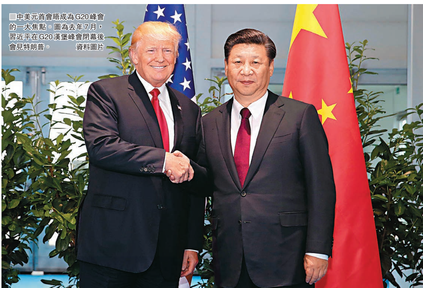
中美元首會晤成為G20峰會的一大焦點。圖為去年7月，習近平在G20漢堡峰會閉幕後會見特朗普。