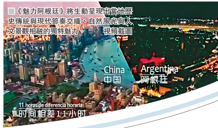
《魅力阿根廷》將生動呈現出當地歷史傳統與現代節奏交織、自然風光與人文景觀相融的獨特魅力。

據悉，四集的《魅力阿根廷》，生動呈現出阿根廷歷史傳統與現代節奏交織、自然風光與人文景觀相融的獨特魅力。而兩集的《魅力中國》，則以阿根廷人的視角，既記錄了中國都市的高速發展和時尚繁華，也展現了西南腹地多彩的自然景觀和多元文化。