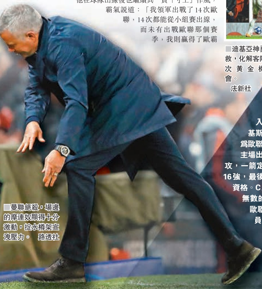
曼聯絕殺，場邊的摩連奴顯得十分激動，掙水樽慶祝。