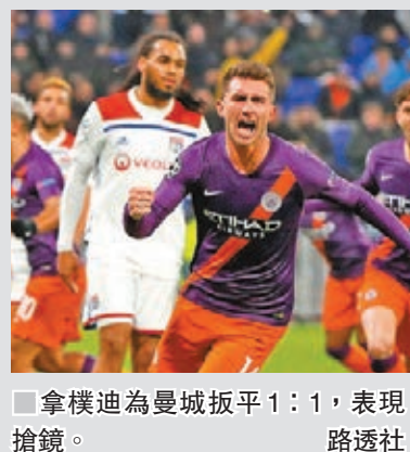
拿模迪為曼城扳平1：1，表現搶鏡。