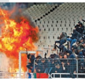
AEK雅典主場觀眾席起火。