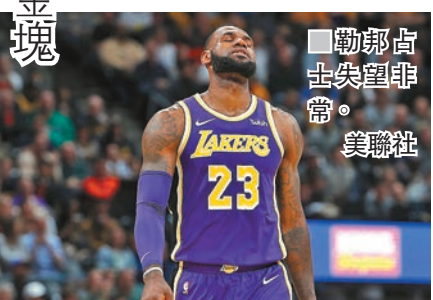
勒邦占士失準非常。

勒邦占士失準 湖人慘負金塊 美國職籃NBA常規賽，今季加盟湖人的勒邦占士發揮失準，結果作客以85：117大敗給丹佛金塊，賽後暫以11勝9負排在西岸第7。整場比賽，湖人三分球35投僅5中，全場投籃命中率僅39.1%，古斯馬攻入21分是全隊最高，但王牌球星勒邦占士只得14分，三分球更是4投盡墨。金塊方面，得分主力後衛加里夏里士因傷缺陣，仍靠着保羅米薩貢獻20分11個籃板的優異表現，取得之前7場6敗後的4連勝。