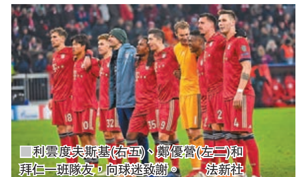
利雲度夫斯基(右五)、鄭優營(左三)和拜仁一班隊友，向球迷致謝。