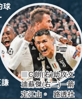
C朗(右)助攻文迪蘇傑(左)一箭定江山。