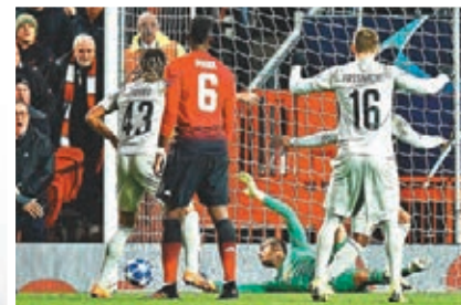
迪基亞神勇撲救，化解客隊一次黃金機會。

自開季後對於曼聯前場組織能力的批評便從未間斷，備受壓力的摩連奴在費蘭尼入球後激動地怒摔水樽慶祝。經常與媒體針鋒相對的他在球隊出線後也繼續其一貫「寸王」作風，霸氣說道：「我領軍出戰了14次歐聯，14次都能從小組賽出線，而未有出戰歐聯那個賽季，我則贏得了歐霸