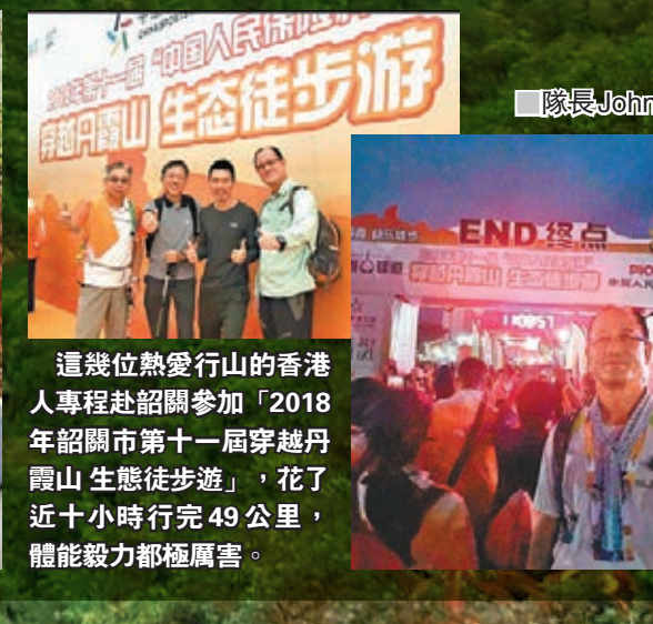
這幾位熱愛行山的香港人專程赴韶關參加「2018年韶關市第十一屆穿越丹霞山生態徒步遊」，花了近十小時行完49公里，體能毅力都極厲害。