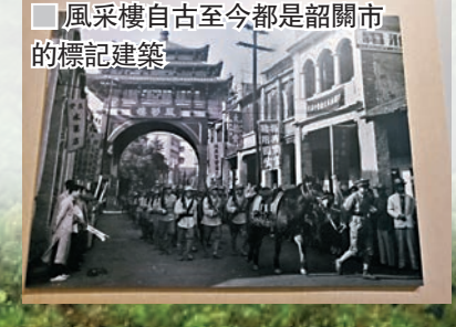
風采樓自古至今都是韶關市的標記建築