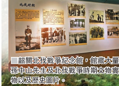
韶關北伐戰爭紀念館，館藏大量孫中山先生及北伐戰爭時期文物實物以及歷史圖片。