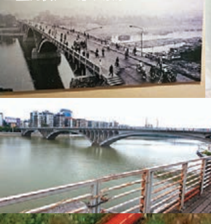
韶關滄江區東堤景象