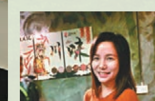
川料理老闆娘熱情好客，拿出珍藏佳釀款客。