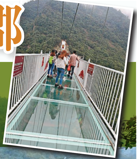
廣東首座全透明玻璃橋韶關雲門山玻璃橋從高空往下看，更是刺激，橋體全長316米，垂直高度達168米。

坦白講，每當有假期外遊，選的目標一定不是廣東省內，一向看不到省內有什麼景點能吸引自己去旅遊，除非一班朋友要跟美食團嬉戲吓。今月初就因為參加香港中旅的「2018年韶關市第十一屆穿越丹霞山生態徒步遊」，來一個3天2夜行程，順便體會一下從西九高鐵往深圳北再往韶關的省時方便經歷。從西九出發到深圳北車程才十多分鐘，比起在西九辦過關手續及等車時間還要短。然後，由深圳北轉韶關才一小時左右，中午已經輕鬆在韶關品嚐地道農家菜，短短兩天對韶關印象改觀了。原來她是「嶺南名郡」，有豐富的內涵，也有許多美食。