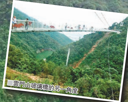
雲門山玻璃橋的另一角度