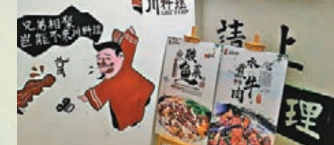
來自四川主廚煮的川菜非常好