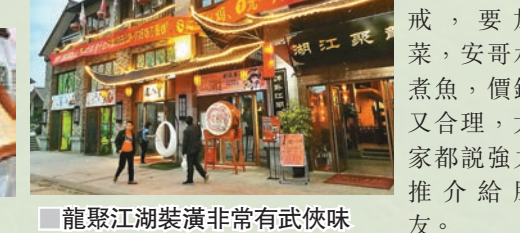
龍聚江湖裝潢非常有武俠味