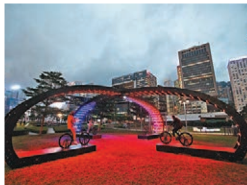
■ Lightbattle X