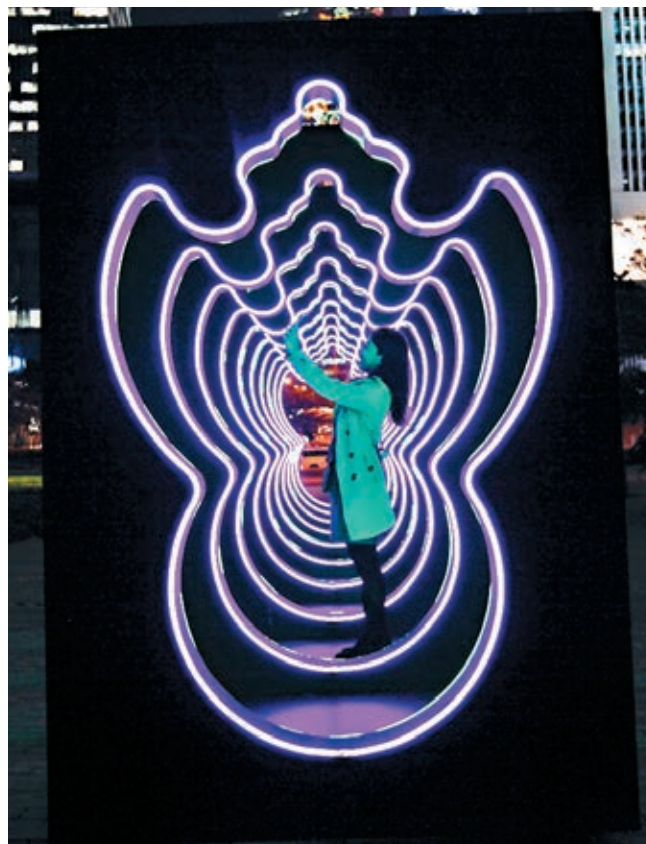
■ 蝠鼠吊金錢

至於過去一直深受港人及旅客歡迎的皇后像廣場聖誕樹亦會由今日起至明年元旦繼續擺放，今年的聖誕樹以冰雪為主題，高19米。