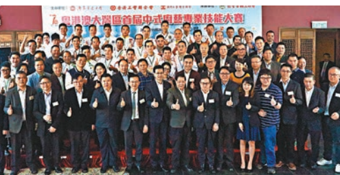
■ 粵港澳大灣區首屆中式廚藝大賽開鑼。

他希望本屆大賽可為大灣區同業提供一個一展所長、「以技會友」的平台，讓大灣區各地名廚發揮廚藝「工匠精神」，提升大灣區內整體飲食業實力，將這個比賽塑造成大灣區內一個行業品牌活動，讓社會各界認識到中式飲食行業發展前景，共