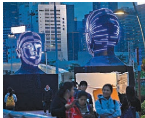
■ Talking Heads