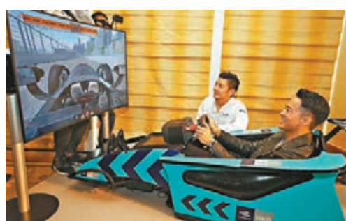
■ 市民可試玩「Race Around Hong Kong」賽車模擬器。