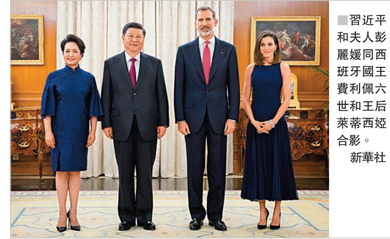
習近平和夫人彭麗媛同西班牙國王費利佩六世和王后萊蒂西亞合影。