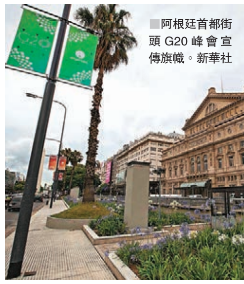
阿根廷首都街頭 G20 峰會宣傳旗幟。

風險挑戰，增強勞動者適應技術變革的能力。我們要支持基礎設施互聯互通建設，幫助發展中國家突破發展瓶頸，實現可持續發展。