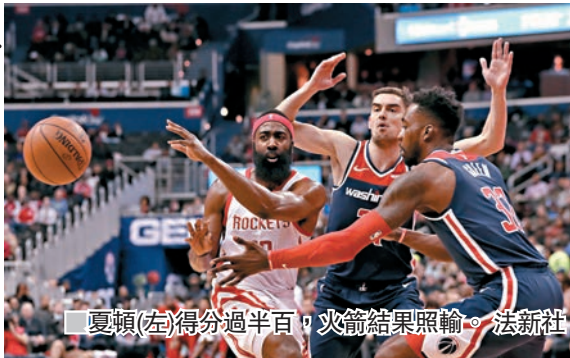
夏頓(左)得分過半百，火箭結果照輸。

本港時間昨日早上NBA常規賽，火箭雖有主力夏頓取得今季個人新高54分，仍於加時以131：135不敵主場的巫師，遭逢3連敗。