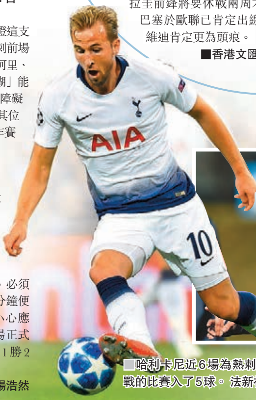
哈利卡尼近6場為熱刺出戰的比賽入了5球。