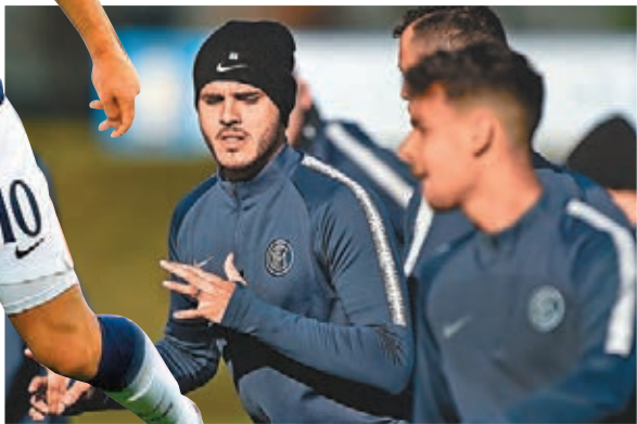
國米前鋒莫路伊卡迪賽前備戰。