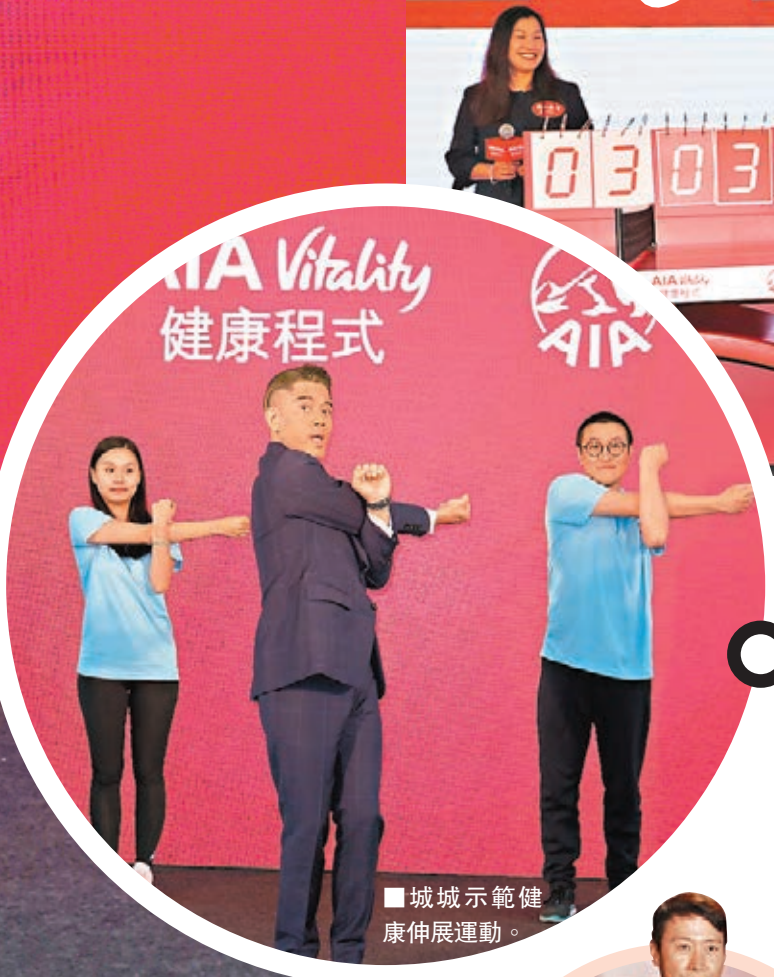
城城示範健康伸展運動。

上大肚裙明顯腹部微隆?城城聞言即展露笑容,稍作思考一下才說:「唔講得住,不過都快,無論怎樣也多謝大家的祝福,這是開心事,畀多少許時間我再向大家公佈!」記者再恭喜他,城城也高興地說多謝!