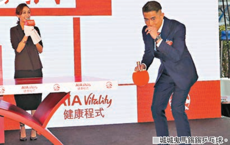
城城鬼馬錫錫乒乓球。