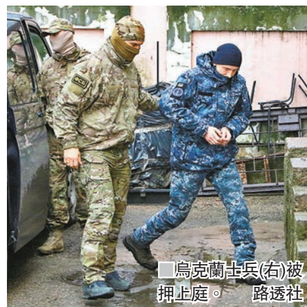
烏克蘭士兵(右)被押上庭。 路透社

俄方的傲慢挑起，要求俄方設法令局勢降溫。烏克蘭駐聯合國大使葉利琴科促請國際社會，對俄羅斯實施新一輪制裁。聯合國秘書長古特雷斯則敦促俄烏兩國緩和緊張局勢。 ■法新社/美聯社