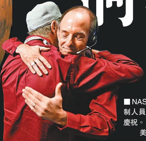
■ NASA 控制人員相擁慶祝。

美國太空總署(NASA)火星探測器「洞察」號，經過半年的太空航行後，前日成功降落火星，是人類歷來第8個登陸火星的探測器，也是繼2012年「好奇」號以來，首個成功登陸的探測器。「洞察」號成功降落的消息傳出後，NASA控制人員，以至在紐約時代廣場觀看直播的民眾都興奮莫名。「洞察」號將在未來兩年，收集火星地質活動數據，讓科學家探索火星構造和環境演變，以至地球等其他行星的起源。