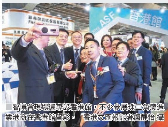
智博會現場還專設香港館,不少參展珠三角製造業港商在香港館留影。

香港文匯報訊(記者 盧靜怡 東莞報道) 此屆智博會圍繞大灣區智能裝備產業發展,今年首次新設三維打印香港館,吸引逾20家香港本土創業的3D打印企業參展,開拓大灣區市場。