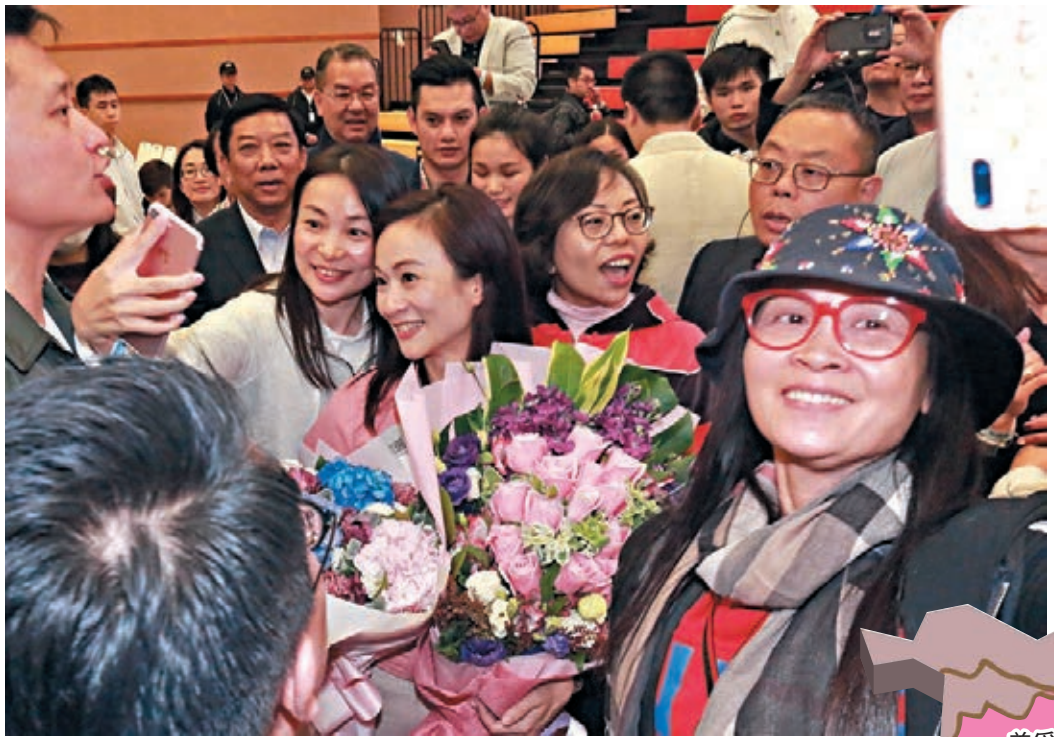
陳凱欣在計票中心接受支持者祝賀。資料圖片