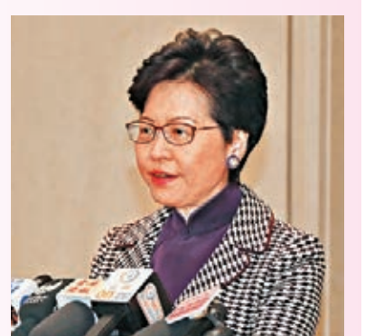
特首林鄭月娥昨日重申，自己非常重視跟立法會的合作。

她重申，自上任以來，自己一直非常重視跟立法會的合作，也較頻密地到立法會，回應各黨派議員對特區施政的意見，並積極跟進他們提出的可行建議，會本着這樣的管治風格，繼續和所有議員合作。