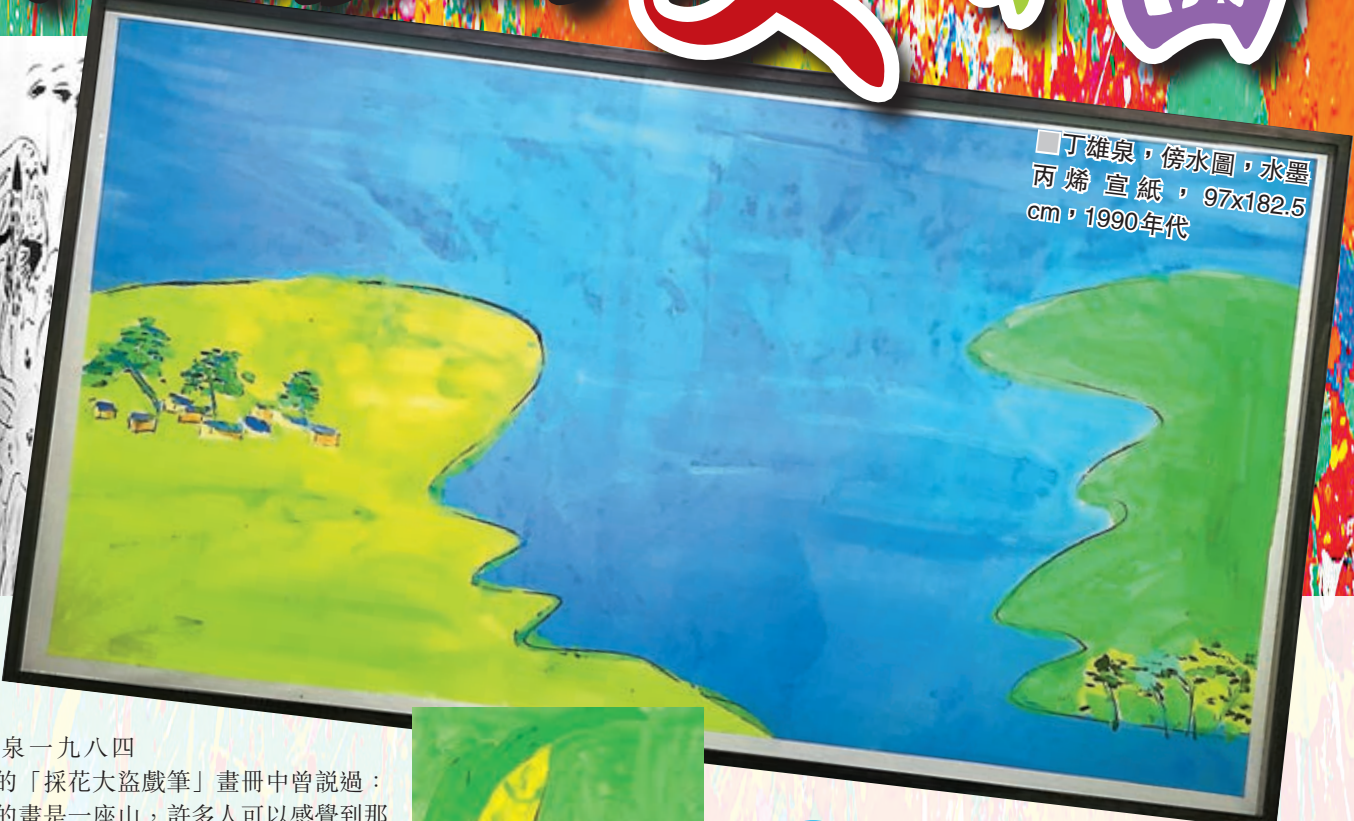
丁雄泉，傍水圖，水墨丙烯宣紙，97x182.5cm，1990年代