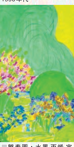
繁春圖，水墨丙烯宣紙，180.5x97.5cm，1990年代