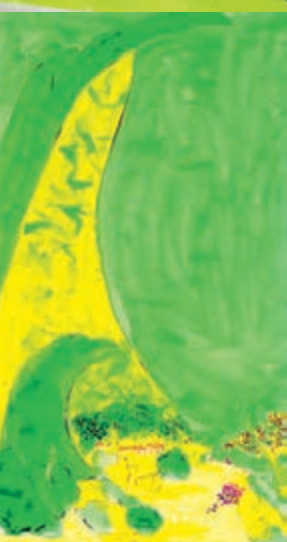
山樹相依圖，水墨丙烯宣紙，180x97.5cm，1990年代