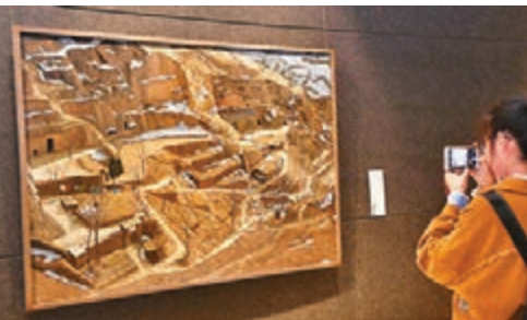
四位畫家的作品散發著厚重的鄉土情懷