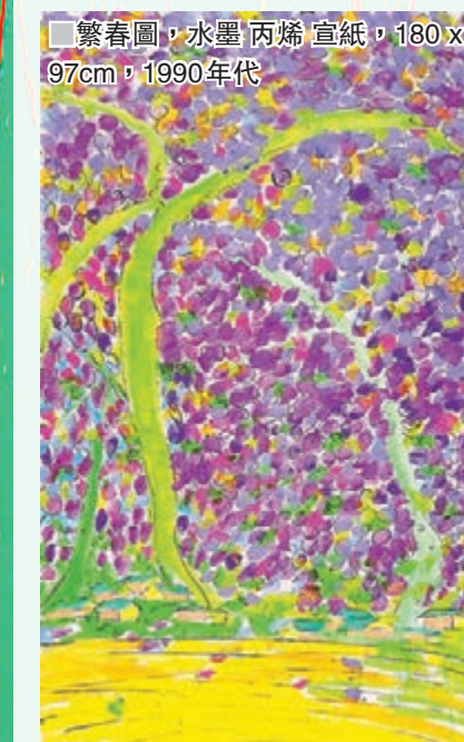
繁春圖，水墨丙烯宣紙，180x97cm，1990年代