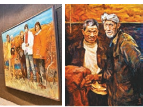
四位畫家的作品散發著厚重的鄉土情懷

眾多優秀作品中精挑細選出來具有代表性的作品，作品傳承創新、相得益彰，具有濃郁的地方氣息。洛陽市委宣傳部副部長張五一指出，本次展覽展示了不同的地域文化特色，表達了創作者對生活的美好祝願，展現了民眾豐富多彩的精神文化生活和積極向上的精神風貌。他希望廣大文藝工作者一要增進交流，取長補短，通過書畫作品傳遞真善美，傳遞向上向善的價值觀，引導人們增強道德判斷力和道德榮譽感。