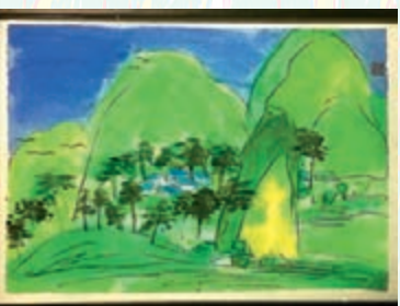
山居圖，水墨亞克力宣紙，66.5x96cm，1990年代

對於丁雄泉創作時的中國靈感，法國賽努奇博物館中國與韓國藏書策展人馬伊爾·貝勒克 (Mael Bellec) 則認為：自一九七零年代起大部分的丁雄泉作品與前人范寬和陳樹人意合，但同時墨線條呈現出壯麗而非寫實的分明輪廓，色彩鮮艷，作品當代性因而呼之欲出。國內著名藝術評論家龔雲表先生則認為：丁雄泉的山水畫，開闢了過去山水畫家從未探過的圖式視域。他以排筆鋪陳之勢營造形態之勢，以色彩和線條的書寫性形式結構，大塊面色彩的平面構成，將他對大自然的內心體驗，跡化成一種個性獨具的純粹的實在，成為他山水畫內在精神性的「有意味的形式」和情感的符號。他作品的構圖佈陣，無不奇崛突兀，出人意料而又合乎情理，雖極奇險而又意韻生動，達到統一下的對立、和諧中的變化。